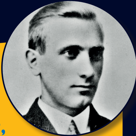
DMYTRO KŁACZKIWS'KYJ „KŁYM SAWUR”, dowódca UPA na Wołyniu:

nakazuję całkowitą, powszechną, fizyczną likwidację ludności polskiej.