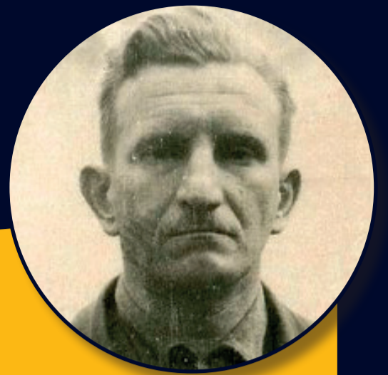
ROMAN SZUCHEWYCZ „TARAS CZUPRYNKA”, naczelný dowódca UPA:

W związku z sukcesami wojsk sowieckich konieczne jest przyspieszenie likwidowania Polaków. Muszą zostać zgładzeni całkowicie, ich wioski spalane do gruntu samego. Ludność polską należy absolutnie zniszczyć. Śmierć każdego Lacha to metr wolnej Ukrainy. Albo będzie lechicka krew po kolana, albo Ukrainy nie będzie. Musimy zatem Polaków w pień wyciąć.