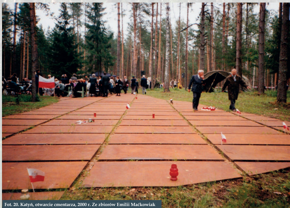
Fot. 20. Katyń, otwarcie cmentarza, 2000 r.