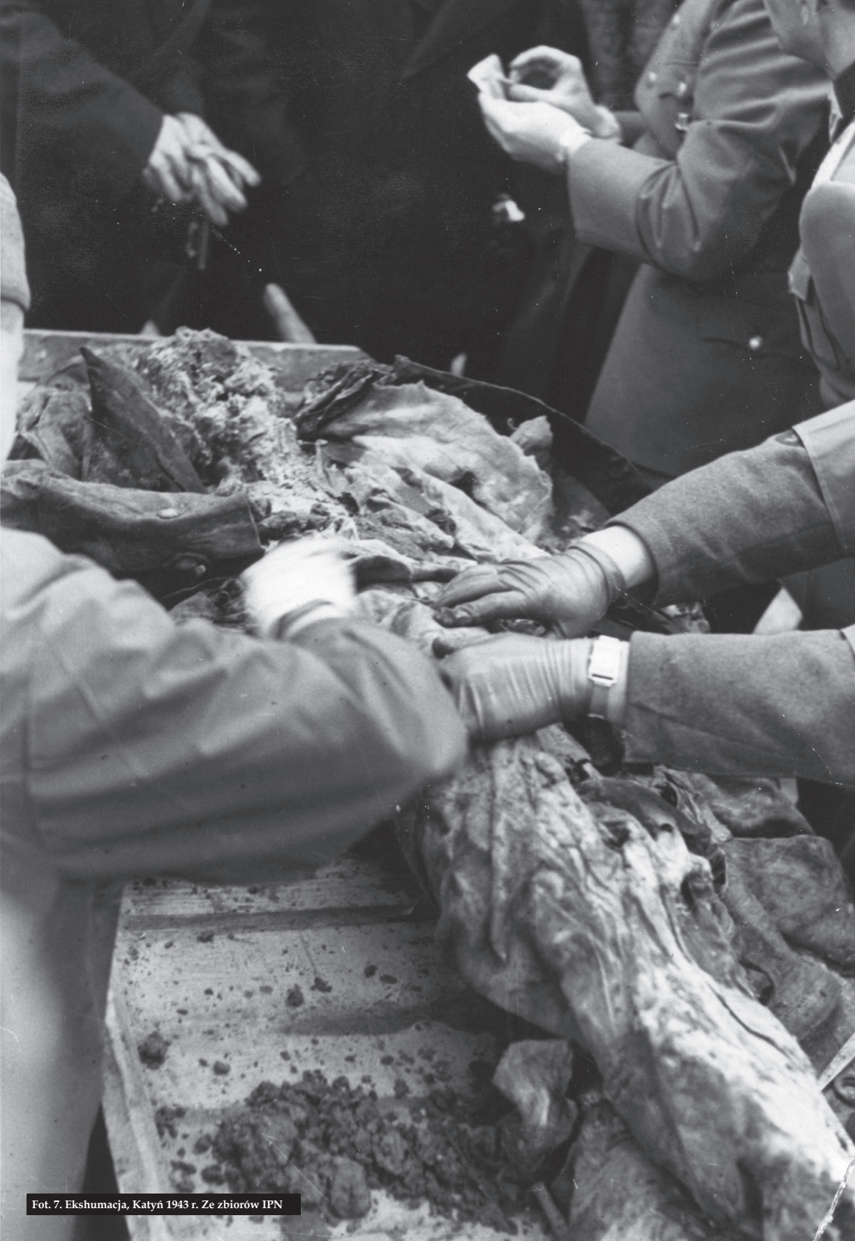
Fot. 7. Ekshumacja, Katyń 1943 r.