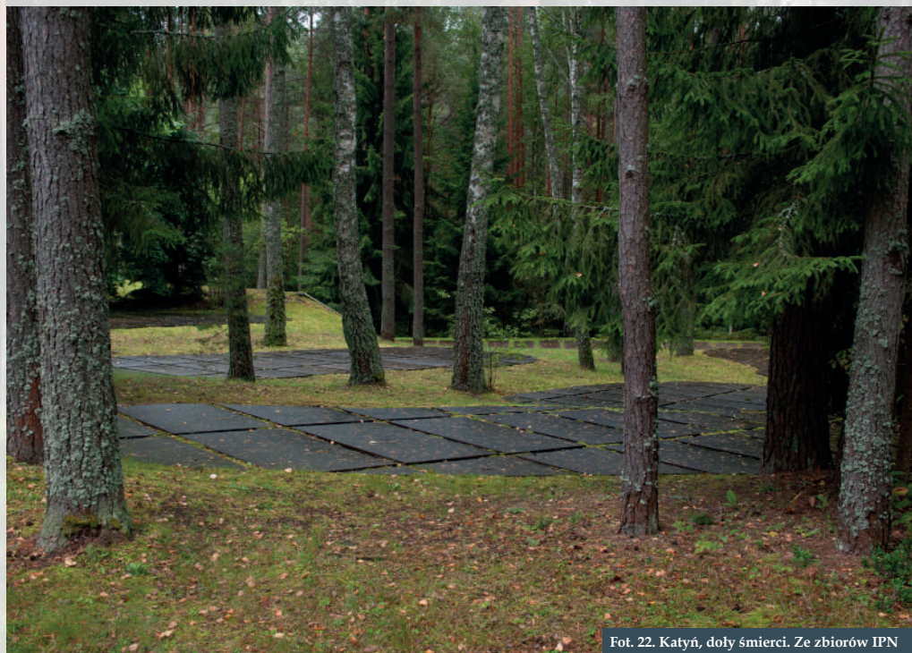
Fot. 22. Katyń, doly śmierci.