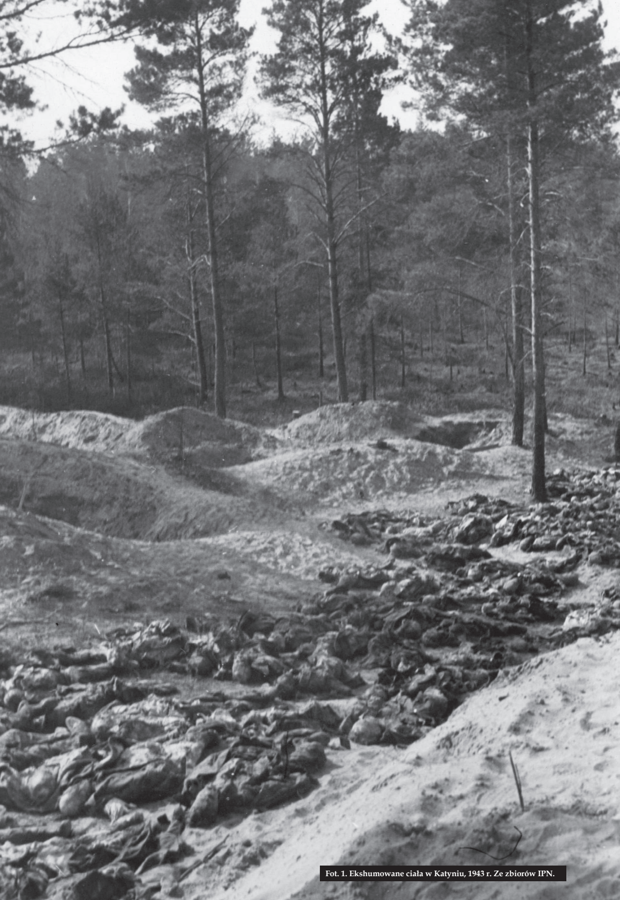
Fot. 1. Ekshumowane ciała w Katyniu, 1943 r.