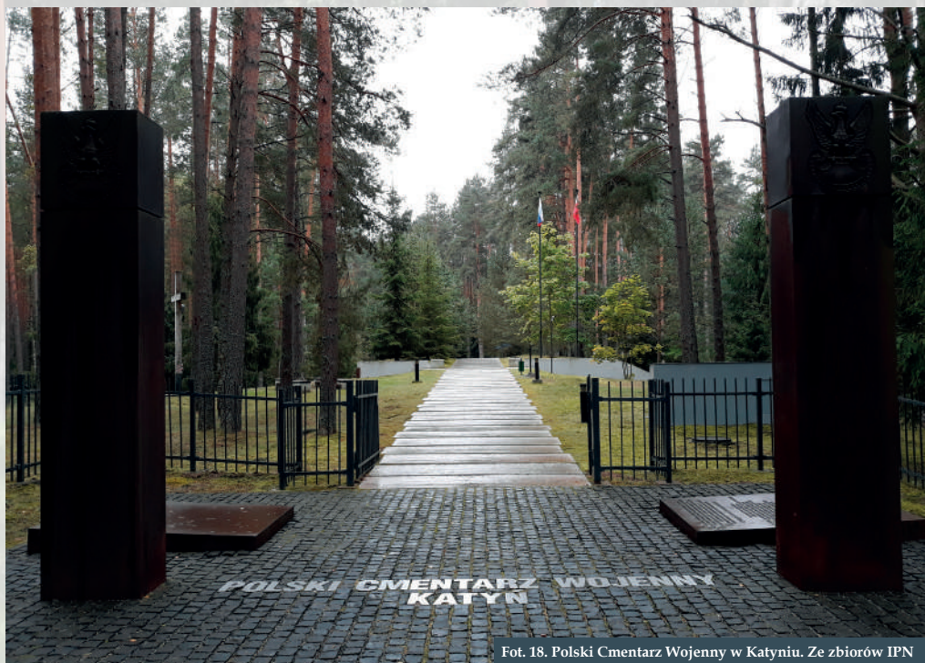
Fot. 18. Polski Cmentarz Wojenny w Katyniu.

Wiosną 1940 r. w Lesie Katyńskim koło Smoleńska stracono i pogrzebano ponad 4400 żołnierzy polskich osadzonych w obozie jenieckim w Kozielsku. Cmentarz został otwarty 28 lipca 2000 r. Obejmuje Polski Cmentarz Wojenny oraz groby obywateli sowieckich – ofiar represji politycznych. Przy wejściu na chodniku z kostki brukowej ułożono napis: „Polski cmentarz wojenny. Katyń”. Zespół ołtarzowy cmentarza składa się z krzyża katolickiego, ściany ołtarzowej z imionami 4413 zamordowanych, ołtarza oraz wpuszczonego w ziemię dzwonu żałobnego, na którym umieszczono zwrotkę z Bogurodzicy . Na terenie Polskiego Cmentarza Wojennego znajduje się siedem dołów śmierci, ósmy grób pozostaje poza granicami cmentarza, w lesie. Zwłoki znalezione w dołach spoczywają obecnie w sześciu wspólnych grobach. Granice grobów zaznaczono prostokątnymi płytami żeliwnymi, na środku każdej z mogił umieszczono krzyż. Wokół polskiego cmentarza wzniesiono ścianę pamięci z nazwiskami 4413 zamordowanych oficerów polskich – każde umieszczono na oddzielnej tabliczce żeliwnej. W osobnych grobach pochowani zostali generałowie Wojska Polskiego – Mieczysław Smorawiński i Bronisław Bohaterewicz.