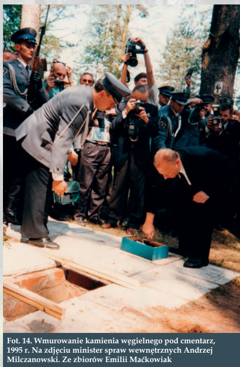
Fot. 14. Wmurowanie kamienia węgielnego pod cmentarz, 1995 r. Na zdjęciu minister spraw wewnętrznych Andrzej Milczanowski.