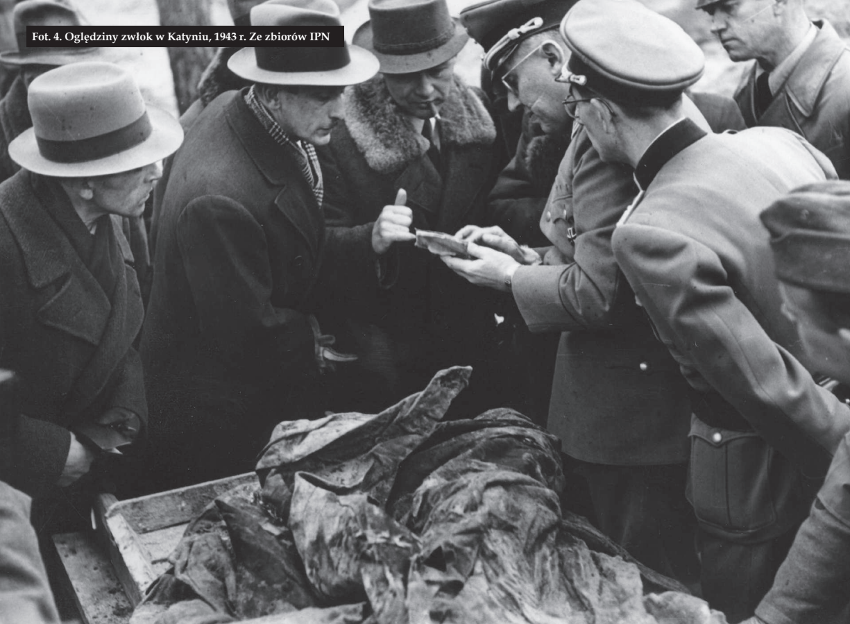
Fot. 4. Oględziny zwłok w Katyniu, 1943 r.