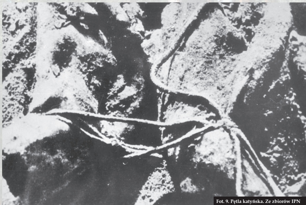
Fot. 9. Pętla katyńska.