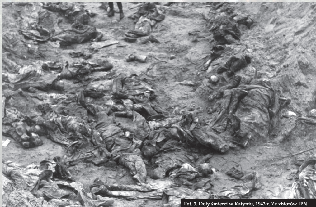
Fot. 3. Doly śmierci w Katyniu, 1943 r.

prawa ogłaszać rozpadu państwa polskiego, tak samo jak nie miał prawa – pod żadnym pozorem – przekraczać polskiej granicy państwowej. Oczywiście, w starciu z potężnymi przeciwnikami, Związkiem Sowieckim i Rzeszą Niemiecką, Polska musiała ulec. Los żołnierzy walczących w jej obronie był różny. Ponad 65 tys. zginęło, części udało się wydostać za granicę, pozostali trafili do niewoli niemieckiej albo sowieckiej. Trzeba tu powiedzieć jeszcze jedną rzecz. Zarówno Niemcy, jak i żołnierze Armii Czerwonej dopuszczali się na żołnierzach Wojska Polskiego ohydnych zbrodni. Nie negują tego nawet źródła sowieckie. Oto cytaty z raportów Armii Czerwonej o tych wydarzeniach: „Dnia 27 września po starciu z wojskami polskimi wzięto do niewoli piętnastu żołnierzy. Na rozkaz starszego lejtnanta ze 146. pułku strzeleckiego, Bułgakowa, działającego w porozumieniu ze starszym politrukiem Kandiurinem, jeńcy zostali ustawieni w szereg i rozstrzelani z działa”; „Dnia 21 września szef Oddziału Specjalnego 2. Korpusu Kawalerii, Kobierniuk, rozstrzelał bez sądu dziesięciu policjantów w obecności prokuratora wojskowego 2. Korpusu Kawalerii Iliczewa i przedstawiciela Trybunału Wojskowego Mielniczenki”. Wróćmy do losu jeńców, którzy dostali się do niewoli sowieckiej. Łącznie było ich ponad 200 tys., chaos towarzyszący działaniom wojennym (ucieczki, brak jasnych dyrektyw, których jeńców zatrzymywać) sprawił jednak, że ostatecznie w rękach sowieckich pozostało około 125 tys. polskich jeńców wojennych.