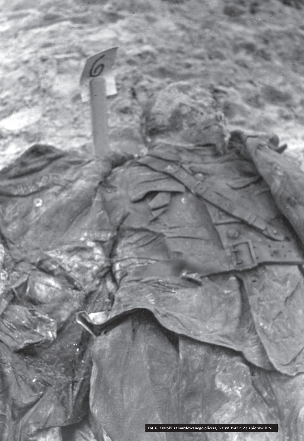
Fot. 6. Zwłoki zamordowanego oficera, Katyń 1943 r.