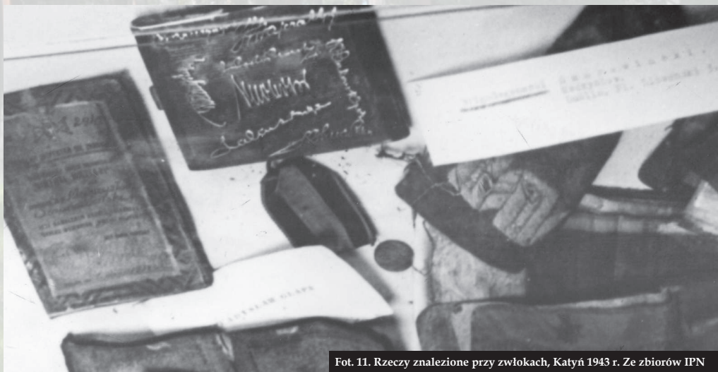
Fot. 11. Rzeczy znalezione przy zwłokach, Katyń 1943 r.

Najliczniejszą grupę ofiar stanowiła polska inteligencja – oficerowie, profesoria, prawnicy, lekarze, nauczyciele, twórcy, urzędnicy i wielu innych. Ten bezprzykładny akt ludobójstwa to zatem nie tylko okrutny cios w kręgosłup i mózg polskiej armii, ale także element planowej akcji eksterminacyjnej, skierowanej przeciw elicie narodu. Ogromu strat duchowych, jakie w ten sposób ponieśliśmy, nie da się ani oszacować, ani wyrównać. Ich dotkliwe skutki kulturowe i moralne były szczególnie widoczne w okresie PRL-u. Odczuwamy je także obecnie.