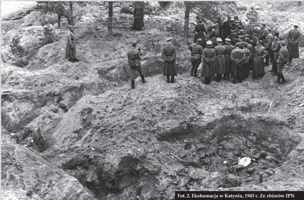
Fot. 2. Ekshumacja w Katyniu, 1943 r.

Po okresie wzajemnej nienawiści w latach trzydziestych, ku zdumieniu światowej opinii publicznej, a nawet części komunistów, bolszewicka Rosja i nazistowskie Niemcy w ciągu zaledwie kilku miesięcy 1939 r. porzuciły wrogość i stały się politycznymi partnerami. Na ołtarzu terytorialnej ekspansji złożono i ideologię, i układy podpisane z innymi państwami, w tym także układ o nieagresji z 1932 r. pomiędzy Związkiem Sowieckim a Polską. Proces zbliżenia agresywnych mocarstw został przypieczętowany 23 sierpnia 1939 r. w Moskwie, kiedy to ZSRS i Rzesza Niemiecka podpisały układ o nieagresji, znany całemu światu jako pakt Ribbentrop-Mołotow. Zawierał on tajny protokół, w którym obaj partnerzy przewidzieli likwidację i podział państwa polskiego. Chociaż Hitler uderzył na Polskę pierwszy, a Związek Sowiecki przyłączył się do napaści dopiero 17 września 1939 r., dopuścił się wobec państwa polskiego takiego samego aktu agresji, jak hitlerowskie Niemcy. Nie mogą tego zmienić tłumaczenia, że państwo polskie „rozpadło się”, albo też, że przekraczając polską granicę, Związek Sowiecki zapewniał bezpieczeństwo swoim zachodnim rubieżom zagrożonym przez Rzeszę Niemiecką. Związek Sowiecki nie miał