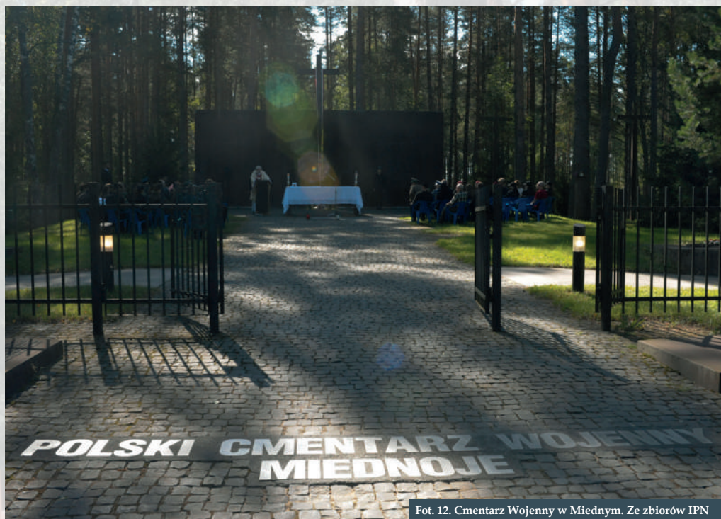
Fot. 12. Cmentarz Wojenny w Miednym.