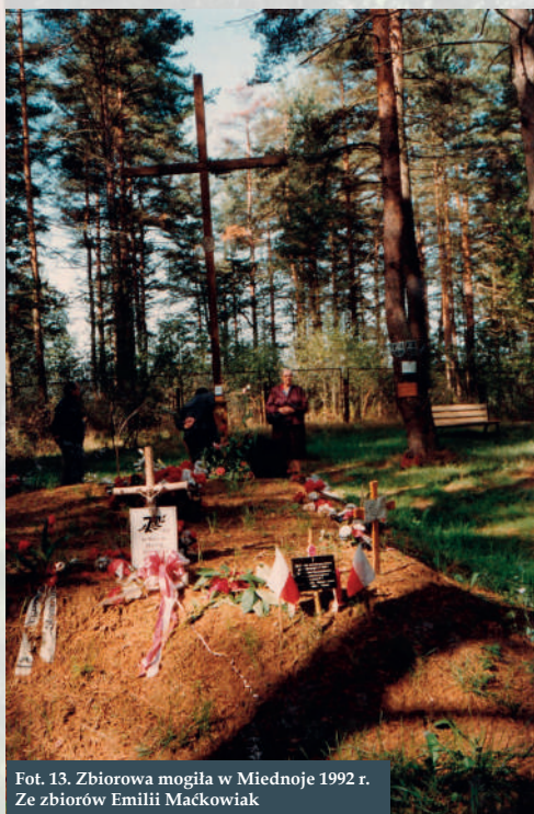
Fot. 13. Zbiorowa mogiła w Miednoje 1992 r.