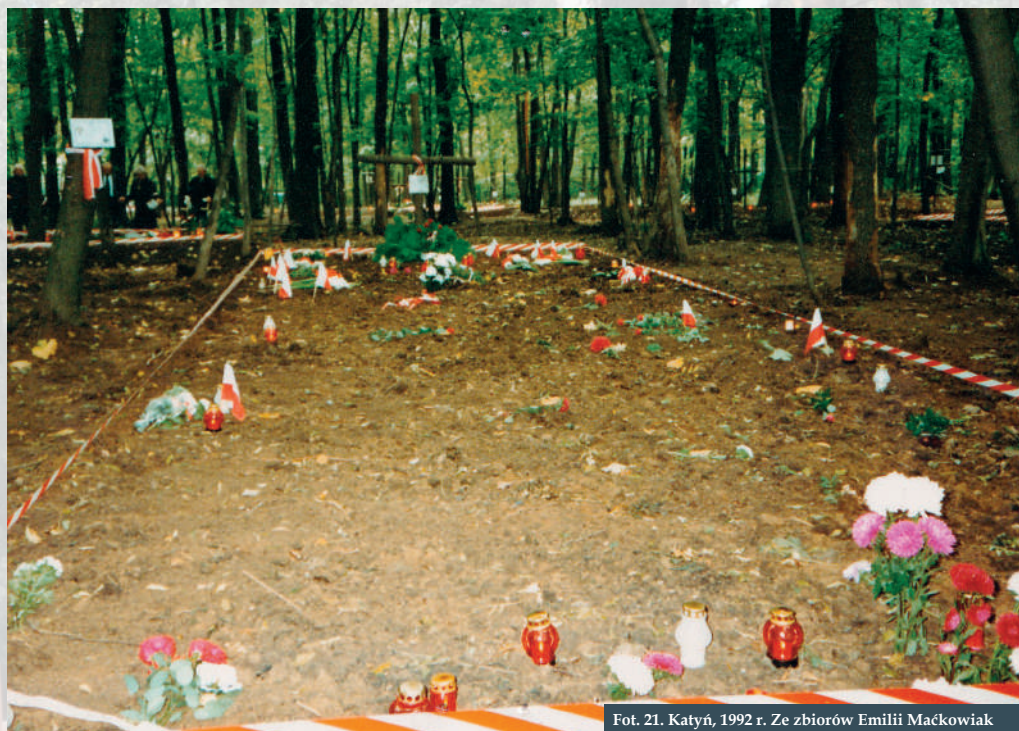
Fot. 21. Katyń, 1992 r.