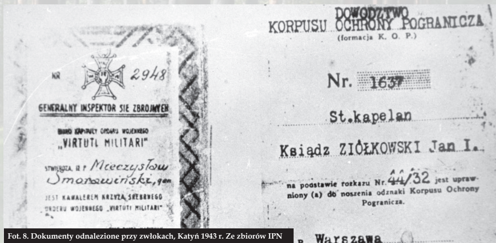
Fot. 8. Dokumenty odnalezione przy zwłokach, Katyń 1943 r.

Obecnie przyczyną tego podziału jest przede wszystkim postawa władz Rosji, które odmawiają przyjęcia jakiegokolwiek odpowiedzialności prawnej za Zbrodnię, umniejszają jej znaczenie i traktują jako jedno z wielu wydarzeń w historii relacji polsko-rosyjskich/sowieckich. To przyzwolenie Kremla jest wykorzystywane w Rosji do reaktywowania kłamstwa katyńskiego, zarówno przez osoby prywatne jak i instytucje, co z polskiej perspektywy jest nie do zaakceptowania.