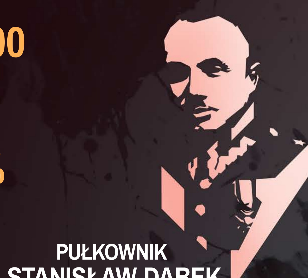
PŁUKOWNIK STANISŁAW DĄBEK