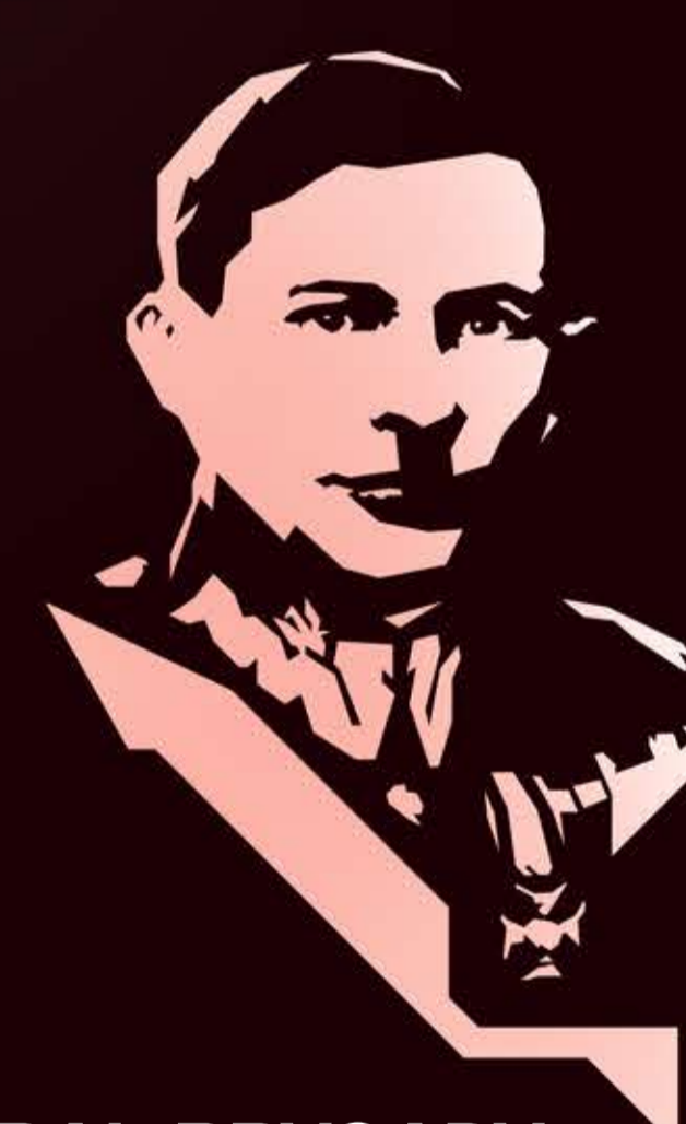
GENERAL BRYGADY WŁADYSŁAW LANGNER