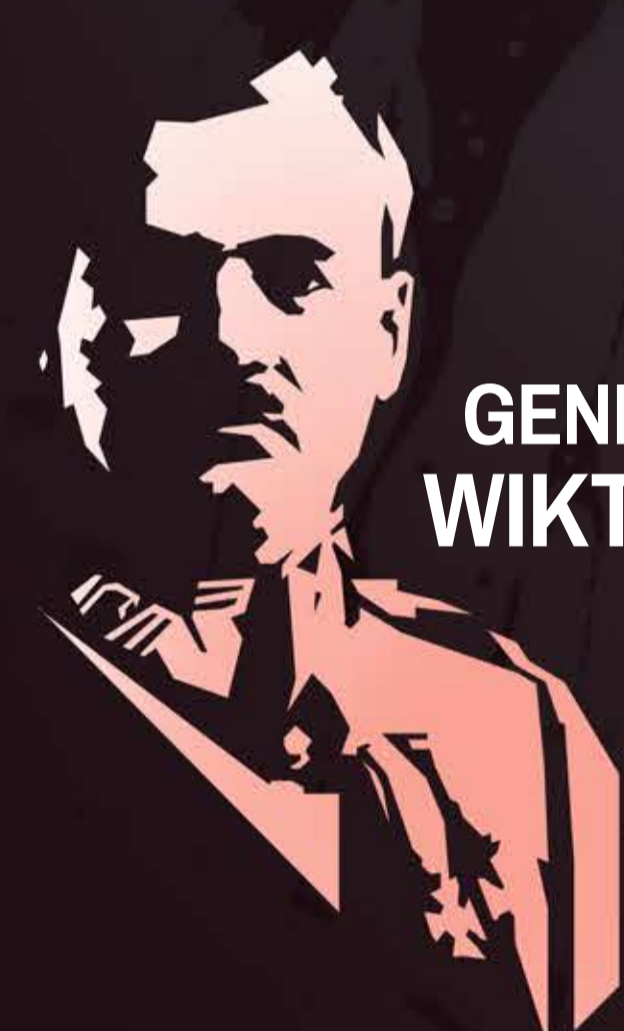
GENERAL BRYGADY WIKTOR THOMMÉE