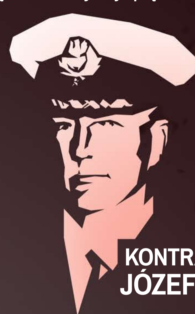
KONTRADMIRAL JÓZEF UNRUG