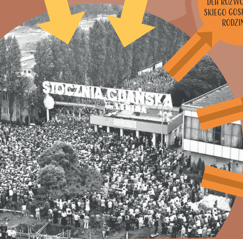
Strajk sierpniowy w Stoczni Gdańskiej im. Lenina

POROZUMIENIA SIERPNIOWE ZOBOWIĄZANIA WŁADZY DO: