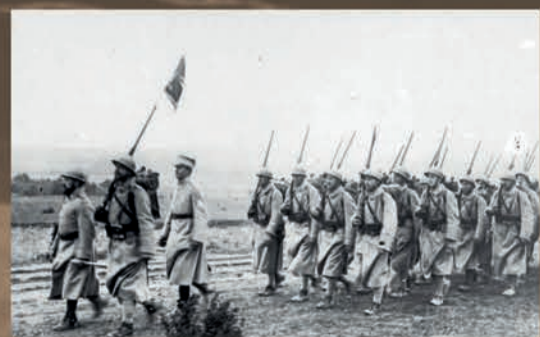
Oddziały Armii Polskiej we Francji w drodze na front, 1918 r.