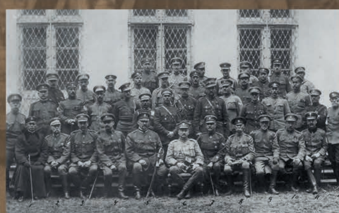
Dowódcy oddziałów I Korpusu Polskiego z generałem Józefem Dowborem-Muśnickim, Bobrujsk 1918 r., fot. NAC