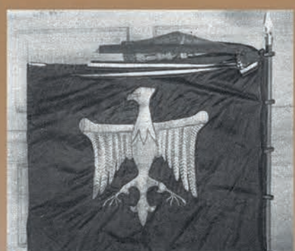
Sztandar polskiej kompanii „Bajorczyków”, 1914 r.

Plakat rekrutacyjny do Armii Polskiej we Francji, 1918 r.