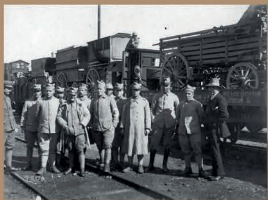
Transport oddziałów armii generała Józefa Hallera z Francji do Polski, 1919 r.

Nabór do Armii Polskiej prowadzono we Francji, Stanach Zjednoczonych, Kanadzie, Brazylii, a pod koniec 1917 r. władze francuskie zezwoliły na przyjmowanie jeńców - Polaków z armii państw centralnych, także z obozów jenieckich we Włoszech. Latem 1918 r. 1 Pułk Strzelców wziął udział w walkach w Szampanii, a w październiku 1. Dywizja Strzelców Polskich obsadziła samodzielnie odcinek frontu w Wogezach.