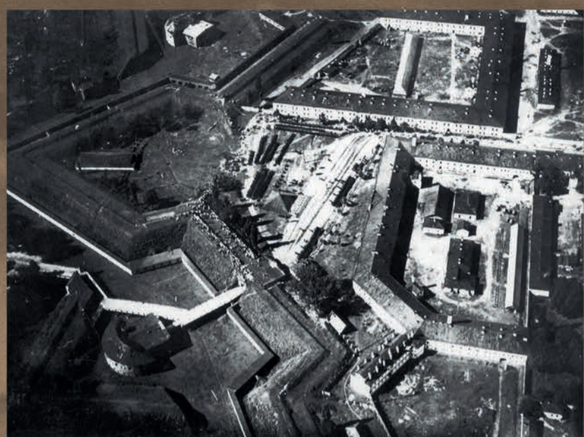
Twierdza w Bobrujsku, główne miejsce koncentracji I Korpusu w Rosji, zdjęcie lotnicze, 1920 r.

II Korpusem dowodził początkowo gen. Sylwester Stankiewicz, później gen. Władysław Glass, a następnie płk Józef Haller. Korpus ten, złożony w części z legionistów II Brygady, skapitulował przed Niemcami pod Kaniowem. III Korpus, którego dowódcą był gen. Eugeniusz de Henning-Michaelis, brał udział w walkach z oddziałami Czerwonej Gwardii na Ukrainie. Skapitulował przed Austriakami w czerwcu 1918 r.