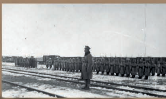
5 Dywizja Syberyjska – oddziały polskie w Harbinie. Powitanie gen. Baranowskiego przez pozostałych przy życiu żołnierzy Dywizji Syberyjskiej, marzec 1920 r.

Dowództwu Armii Polskiej we Francji podlegała również 5 Dywizja Piechoty na Syberii