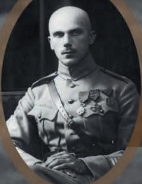
Plk Kazimierz Rumsza, dowódca 5 Dywizji Syberyjskiej