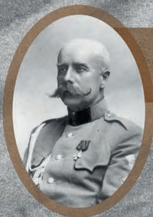
Gen. Eugeniusz de Henning-Michaelis, organizator i dowódca III Korpusu w Rosji

Żołnierze Dywizji Strzelców Polskich z ofiarowanymi im standarami z powstania listopadowego, 1917 r.