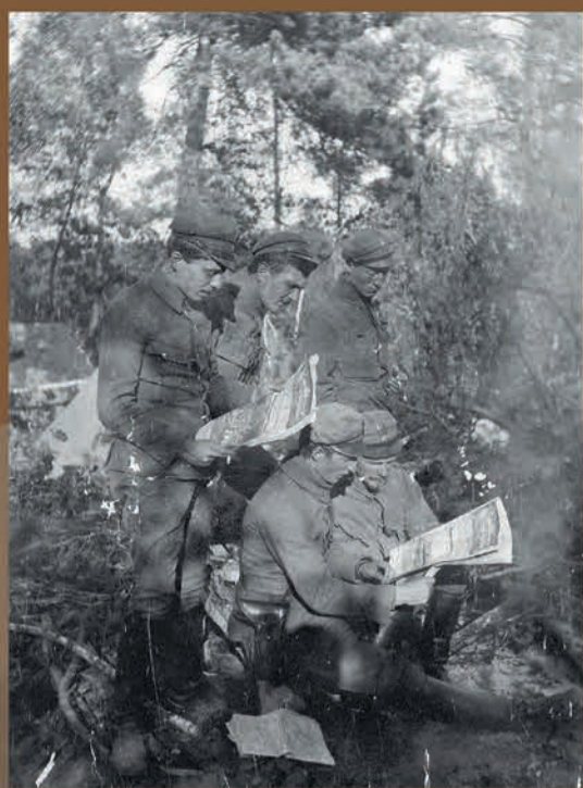
Oficerowie 5 batalionu Legionów Polskich przeglądają prasę w lesie pod Dubniakami, 1916 r.

W połowie sierpnia, już na terenie Królestwa Polskiego, dołączyły następne kompanie, z których sformowano 1 Pułk Legionów Polskich, przekształcony pod koniec roku w I Brygadę LP. W roku 1915 utworzono jeszcze Brygady II i III. Walczyły one w Karpatach i na Wołyniu. W 1917 r. Piłsudski zerwał z Państwami Centralnymi; został aresztowany przez Niemców, a Legiony rozwiązano. Z ich resztek utworzono zależny od Austrii Polski Korpus Posiłkowy oraz podległą Niemcom szczątkową Polską Siłę Zbrojną. W listopadzie 1918 r. odegrała ona istotną rolę we wskrzeszeniu Wojska Polskiego.