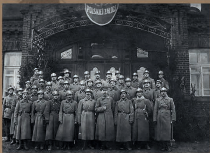
I Korpus Polski – grupa oficerów 1 pułku inżynierii przed jednym z budynków twierdzy Bobrujsk

Najlepiej zorganizowana polska formacja w Rosji, I Korpus gen. Dowbora-Muśnickiego, rozlokowana była na Białorusi. W walkach z Czerwoną Gwardią na początku lutego 1918 r. Korpus zdobył twierdzę Bobrujsk, która stała się później główną bazą formacji. Korpus skutecznie walczył przeciwko bolszewikom, lecz 21 maja 1918 r. został rozbrojony przez oddziały niemieckie, a jego żołnierzy odesłano do Warszawy.