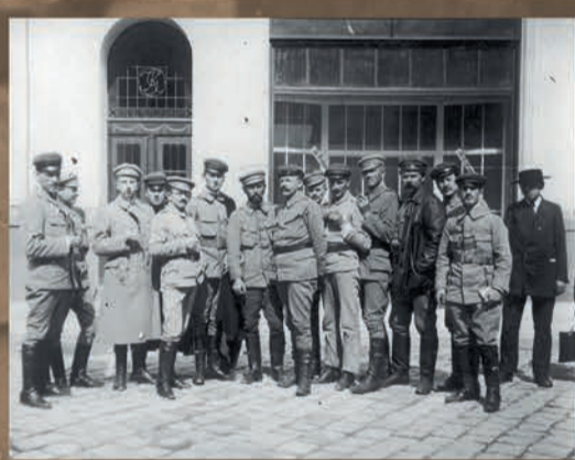
Rada Główna Związku Walki Czynnej, 1914 r., fot. NAC

Biuro werbunkowe Legionów Polskich w Krakowie, 1914 r., fot. NAC