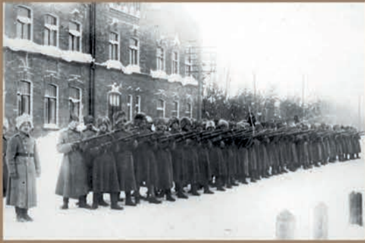
5 Dywizja Syberyjska – ćwiczenia Szkoły Oficerskiej, 1918-1919 r.

Prezydent Republiki Francuskiej Raymond Poincaré powołał regularną armię polską dekretem z 4 czerwca 1917 r. Miała ona walczyć po stronie wojsk Ententy pod własnymi sztandarami, lecz pod dowództwem francuskim. Pierwszym naczelnym dowódcą Armii Polskiej we Francji został gen. Louis Archinard. W związku ze zmianami z 28 września 1918 r. naczelne dowództwo objął 4 października 1918 r. gen. Józef Haller.