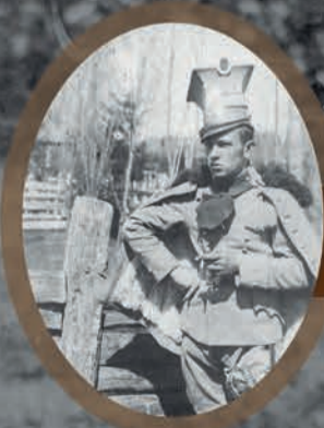
Ułan legionowy, 1914 r., fot. NAC