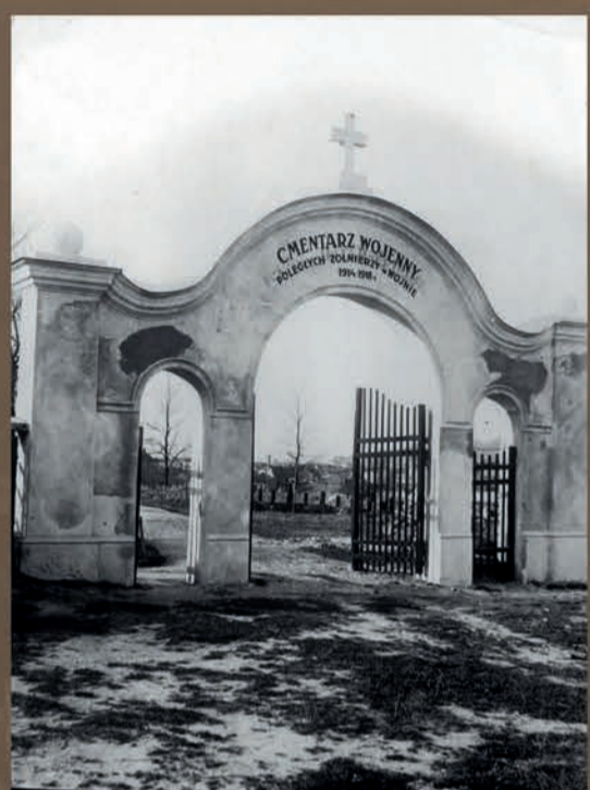
Lwów. Cmentarz żołnierzy poległych w I wojnie światowej