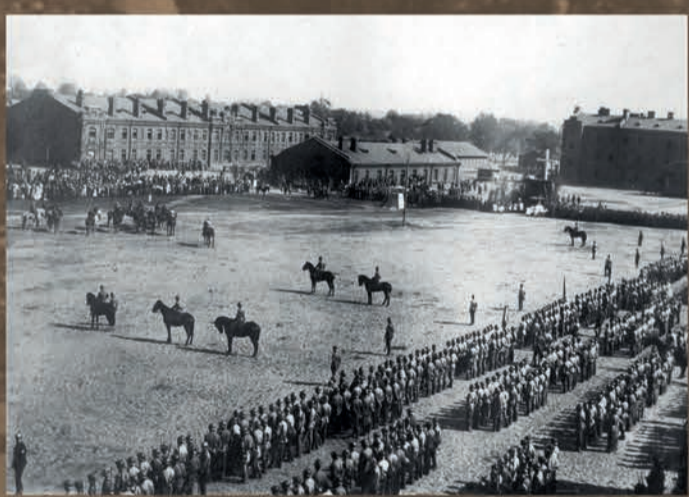
I Korpus Polski w Rosji – święto 3 Maja, 1918 r.

...a Ta, powstaje z naszej co nie zginęła, Krwi!