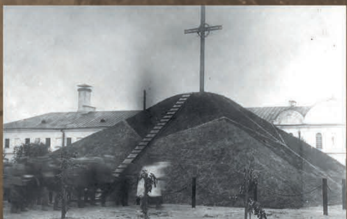
Poświęcenie kopca ku czci poległych żołnierzy I Korpusu polskiego, 1918 r.