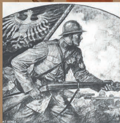
ARMIA POLSKA WE FRANCJI POLISH ARMY IN FRANCE CENTRUM REKRUTACYJNE RECRUITING CENTRE No 1

Plakat rekrutacyjny do Armii Polskiej we Francji, 1918 r., fot. NAC