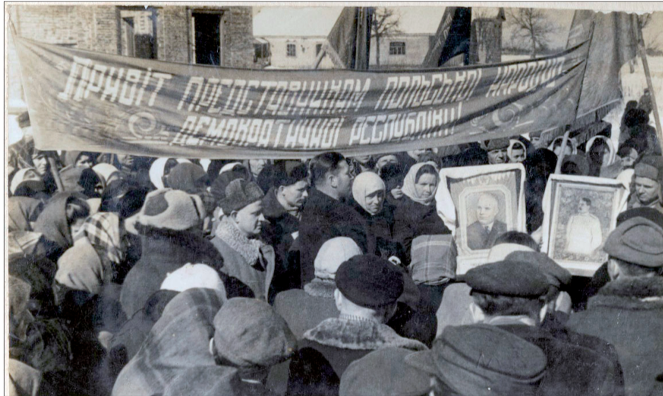
Powitanie delegacji polskich chłopów w kołchozie „Czerwona Gwiazda” w obwodzie połtawskim, 1948/1949.

W myśli społeczno-politycznej klasyków marksizmu-leninizmu następstwem kolektywizacji miała być likwidacja wyzysku na wsi. Skupieni w kolektywnych gospodarstwach mało- i średniorolnicy mieli się skutecznie oprzeć konkurencji dużych gospodarstw towarowych. Realizatorzy kolektywizacji w Związku Sowieckim (lata 30. XX w.) chętnie odwoływali się do owych rozważań teoretycznych, aczkolwiek przyświecały im zgoła inne cele. Kolektywizacja wsi była jednym z elementów inżynierii społecznej. Umożliwiała rozciągnięcie kontroli nad chłopami, którzy dotychczas – dzięki posiadaniu własnego warsztatu pracy – skutecznie unikali kurateli państwa. Ostateczne przejście władzy przez komunistów w państwach położonych na wschód od Łaby nastąpiło na przełomie lat 1947/1948. Li-