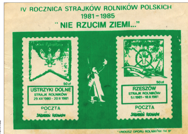
Cegielka na Fundusz Oporu Rolników wydana z okazji czwartej rocznicy strajków i porozumień w Ustrzykach Dolnych i Rzeszowie.