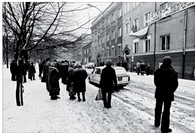
Ludzie wyczekujący na informacje przed budynkiem byłej WRZZ w Rzeszowie.

Sukces robotników, którzy swoją determinacją wymusili na rządzących rejestrację NSZZ „Solidarność” mobilizował do działań w podobnym zakresie także środowiska wiejskie. Wybuch 29 grudnia 1980 r. strajku w Ustrzykach Dolnych, a potem jego rozszerzenie 2 stycznia 1981 r. o strajk w Rzeszowie stały się dobitnym wyrazem pragnień rolników, by posiadać również własne niezależne związki zawodowe. Więcześniejszy strajk w Ustrzykach Dolnych, przed Świętami Bożego Narodzenia w 1980 r. złożył wizytę bp. I Tokarczukowi. Zrelacjonował ją następująco: Powiedzieliśmy biskupowi, że chcemy rozpocząć strajk, gdyż jesteśmy przez władze represjonowani. (...) Biskup nas wysłuchał, potem zachęcił, radził jednak, aby zacząć strajk po Nowym Roku. Tak się jednak nie stało . Gdy rozpoczął się strajk w Ustrzykach Dolnych W. Nowacki pojawił się ponownie