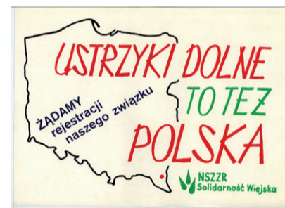
Plakat Komitetu Strajkowego w Ustrzykach Dolnych.

W atmosferze narastających frustracji wynikających z postawy rządzących lekceważących sprawy wsi oraz prawo rolników do zrzeszania się 29 grudnia 1980 r. doszło do rozpoczęcia strajku okupacyjnego w Urzędzie Miasta i Gminy w Ustrzykach Dolnych. Wydarzenie to miało charakter żywiołowy i oddolny, co nie oznacza jednak, że nie poprzedzały go wcześniejsze