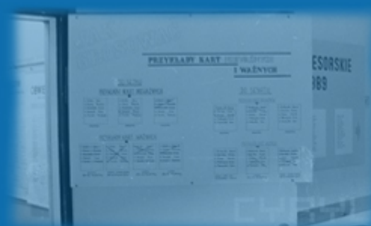
Instrukcja dla głosujących w jednym z lokali wyborczych w Poznaniu, 4 VI 1989.

! Głosowano poprzez skreślanie konkurentów wybranych kandydatów.