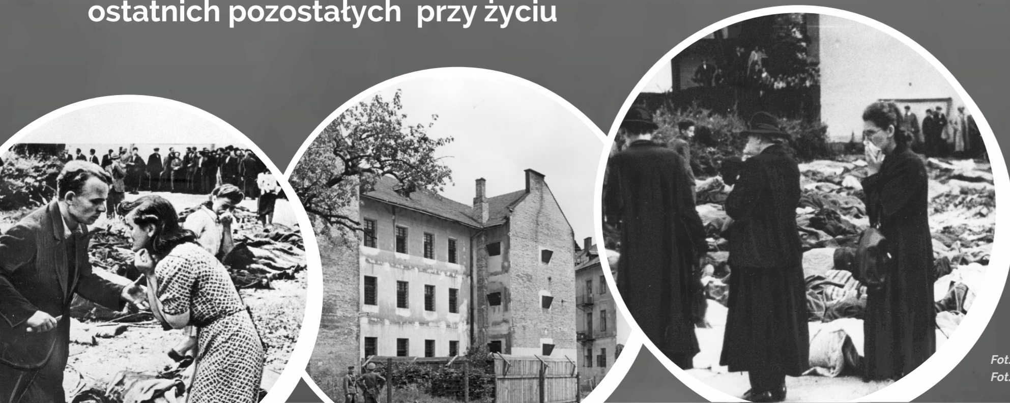
Fot. 1 i 3: Rodziny próbujące rozpoznać bliskich wśród zamordowanych na terenie więzień w Lwowie Fot. 2: Tylny dziedziniec więzienia NKWD w Lwowie

Tadeusz Rakoczyński (ocalał z więzienia "Brygidki")