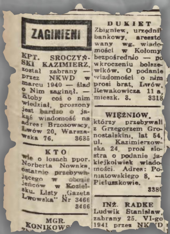
Nowy Kurjer Warszawski, nr 159, 162 z lipca 1941 r. ▶

Szacowana liczba ofiar likwidacji więzień wynosi od 20 do 30 tysięcy osób.