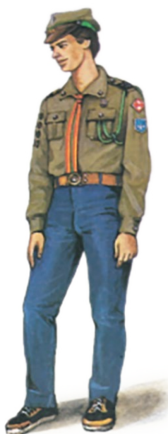
Harcerz starszy 1988 r.