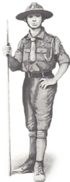
Harcerz 1921 r.