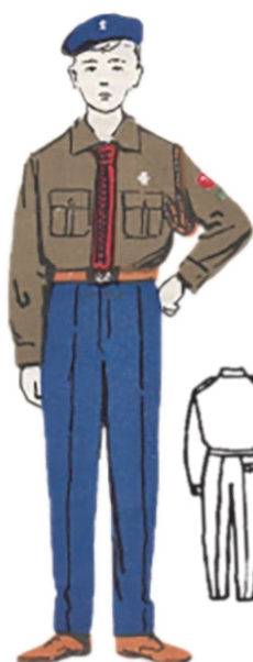
Harcerz starszy 1965 r.