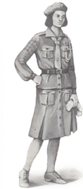
Wędrowniczka (harcerka starsza) 1938 r.