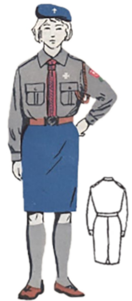
Harcerka starsza 1965 r.