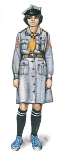
Harcerka starsza 1988 r.