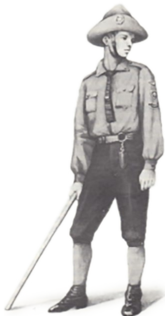
Skaut lwowski 1912 r.