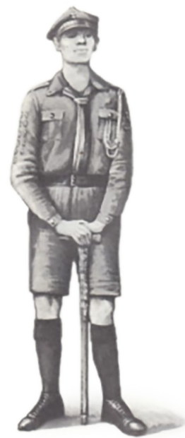
Harcerz 1939 r.