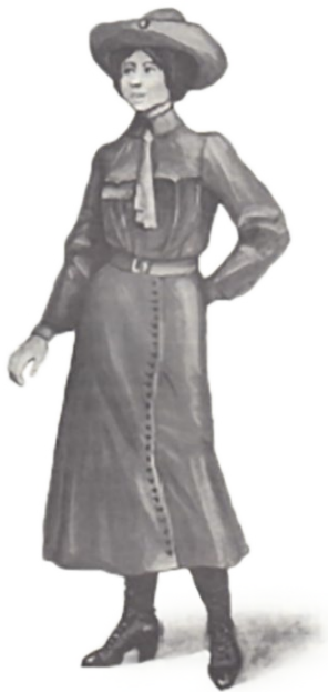
Skautka lwowska 1912 r.