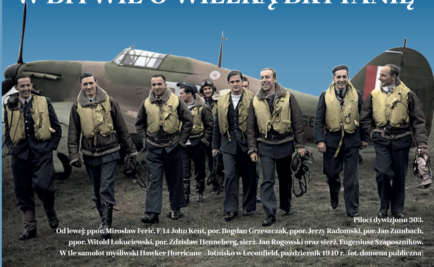
Piloci dywizjonu 303.