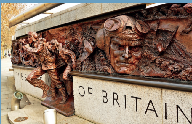
Pomnik Bitwy o Wielką Brytanię na nabrzeżu Wiktorii w Londynie. Płaskorzeźby przedstawiają sceny z bitwy. Na tablicach wyryto nazwiska wszystkich pilotów, którzy wzięli udział w bitwie oraz słynne zdanie premiera Winstona Churchilla z przemówienia wygłoszonego 8 sierpnia 1940 r.: „Nigdy w dziejach ludzkich konfliktów tak wielu nie zawdzięczało tak wiele tak nielicznym”.

303. Dywizjon Myśliwski „Warszawski” im. Tadeusza Kościuszki został sformowany 2 sierpnia 1940 r. w bazie RAF w Northolt, położonej na obrzeżach Londynu. Dywizjon został przydzielony do 11. Grupy Lotnictwa Myśliwskiego, która broniła stolicy i obszaru południowo-wschodniej Anglii. Status jednostki operacyjnej otrzymał 31 sierpnia.