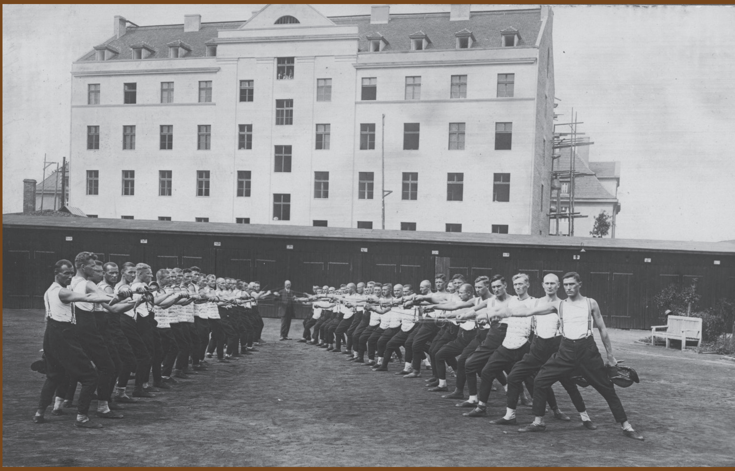
Sport był ważnym elementem szkoleń policjantów, ponieważ pomagał w utrzymaniu dobrej kondycji fizycznej. Na zdjęciu kurs fizycznego wyszkolenia w Komendzie Rezerwy PWŚI. w Katowicach, 1925–1926 r.