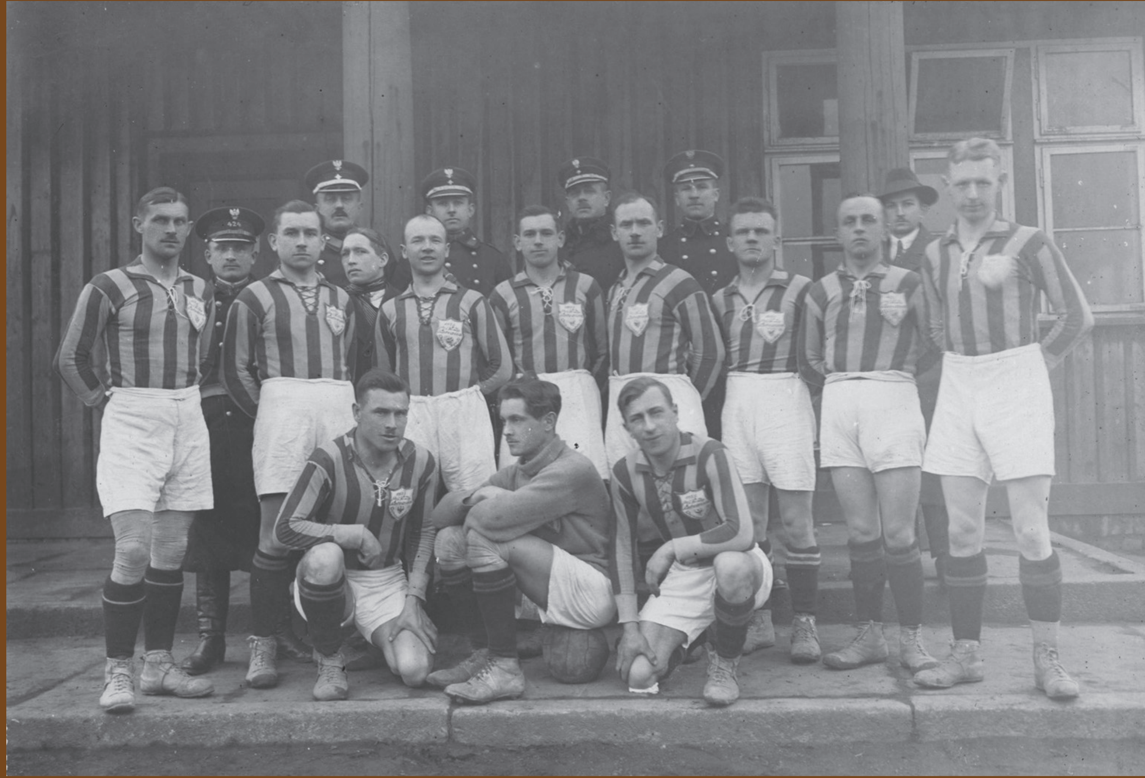
Jedną z popularniejszych dyscyplin sportowych uprawianych przez funkcjonariuszy w ramach policyjnych klubów sportowych była piłka nożna. Na zdjęciu drużyna piłkarska Policyjnego Klubu Sportowego w Katowicach, 1924–1926 r.