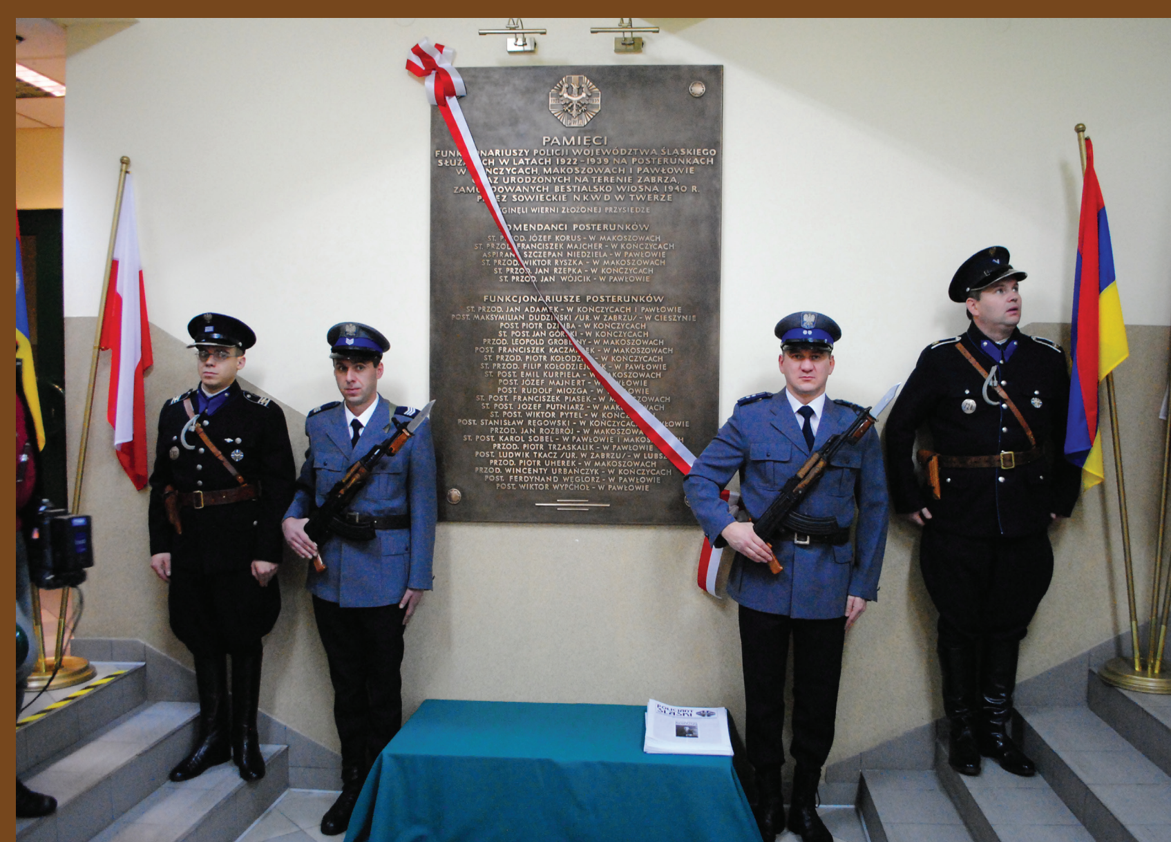
Odświeżenie tablicy pamiątkowej poświęconej funkcjonariuszom PWŚł., ofiarom Zbrodni Katyńskiej, na terenie Komendy Miejskiej Policji w Zabrze, 9 listopada 2012 r. Asystują członkowie grupy rekonstrukcyjnej Policji Województwa Śląskiego