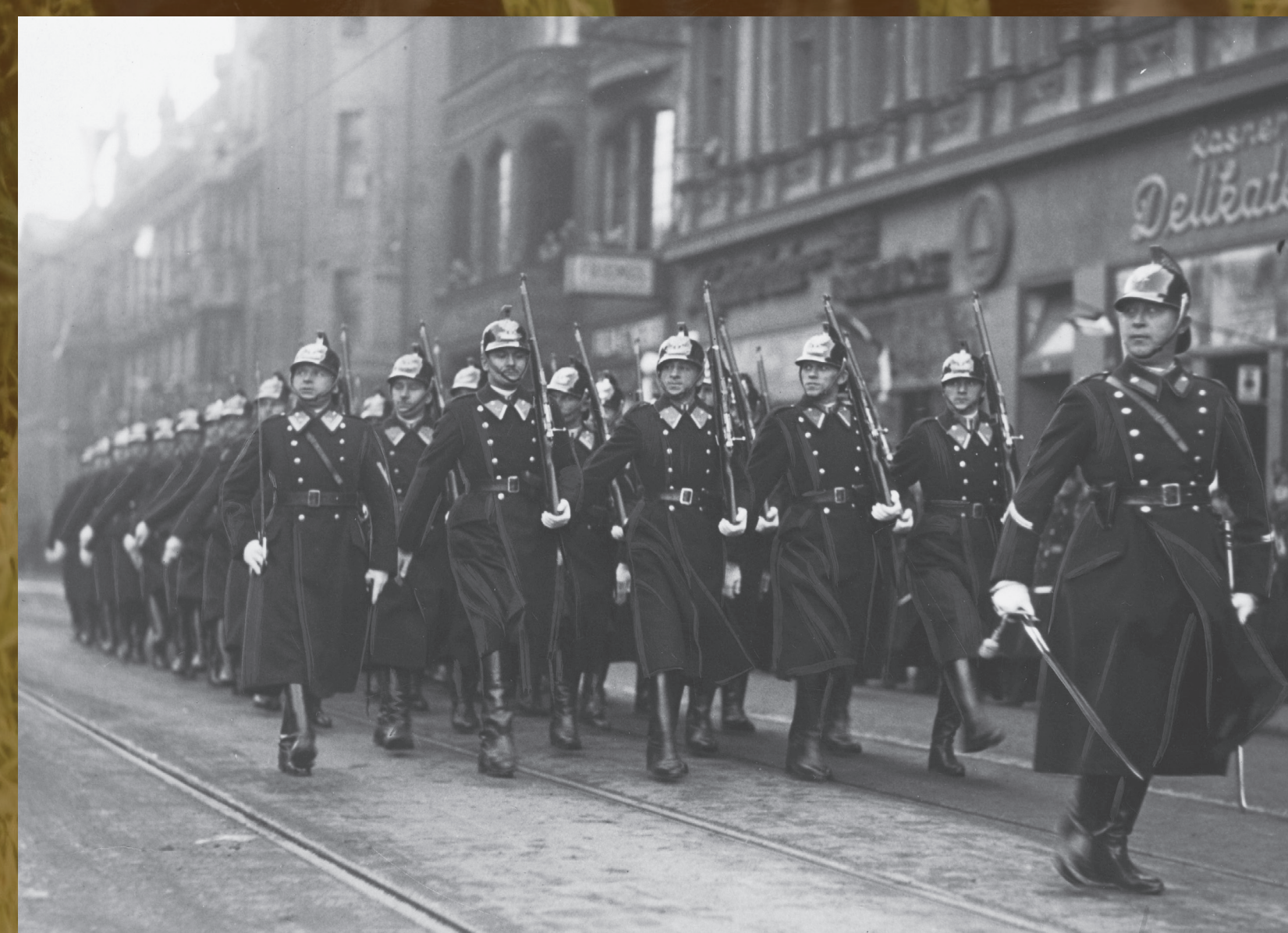
Defilada kompanii honorowej PWSi. w mundurach galowych na uroczystościach z okazji imienin marsz. Józefa Piłsudskiego, Katowice, 1936 r.