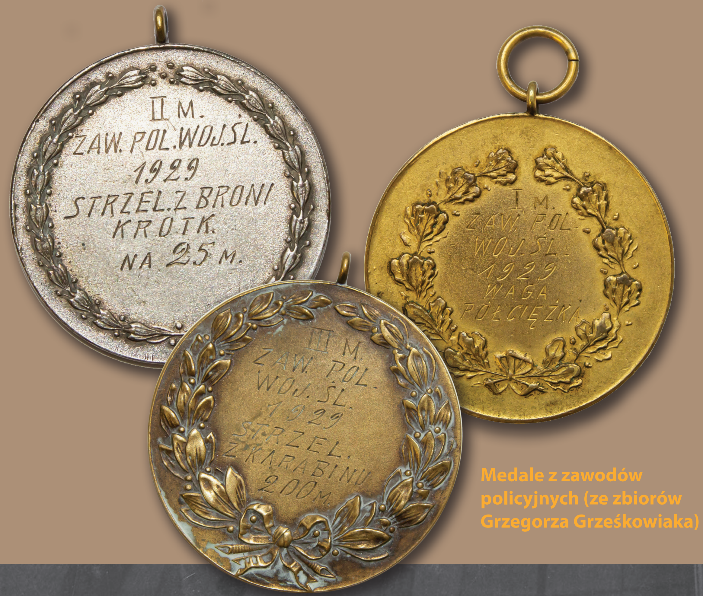
Medale z zawodów policyjnych

Wkrótce po utworzeniu śląskiej policji zaczęto również zakładać policyjne kluby sportowe. Działalność ta wspierana była przez Główną Komendę PWŚI., świadomą wagi dobrej kondycji fizycznej funkcjonariuszy. W 1924 r. w Katowicach powstał Policyjny Klub Sportowy „Katowice”, który w następnych latach wchłonął mniejsze kluby z innych miejscowości, stając się reprezentacyjnym klubem województwa. Działał on aż do wybuchu II wojny światowej i trenował sportowców w ramach wielu sekcji. Śląscy policjanci z powodzeniem startowali m.in. w Ogólnokrajowych Zawodach Sportowych Policji Państwowej. Poza rywalizacją typowo policyjną przedstawiciele takich dyscyplin jak boks czy szermierka odnosili sukcesy na arenach krajowych i międzynarodowych, reprezentując Polskę także podczas XI Letnich Igrzysk Olimpijskich w Berlinie w 1936 r.