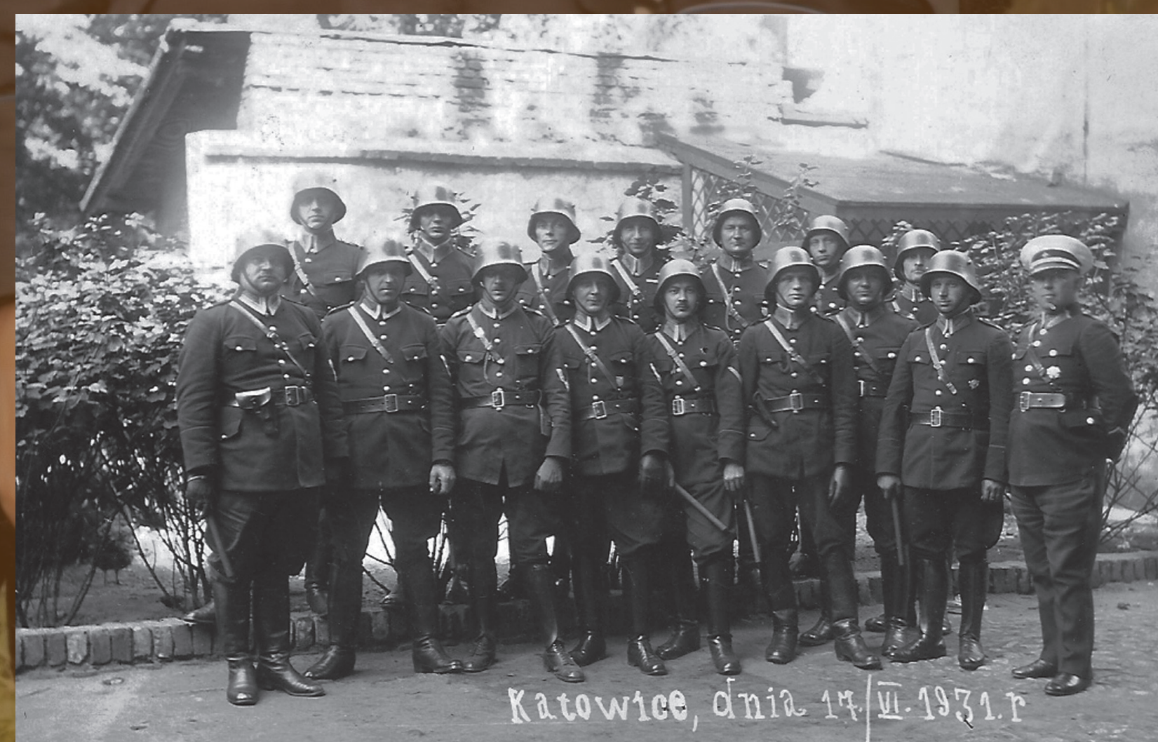
Pluton z Komendy Rezerwy PWSi. w Katowicach z tzw. wyposażeniem alarmowym, 17 czerwca 1931 r.