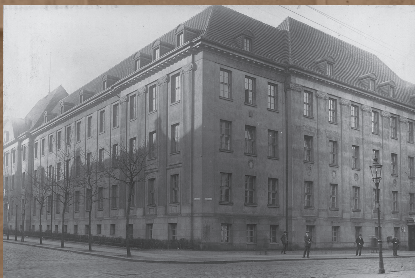
Gmach Głównej Komendy PWŚl. w Katowicach, widok z rogu ulic Jana Kilińskiego oraz Zielonej (od 1933 r. ul. Żwirki i Wigury), ok. 1927 r.

Policja Województwa Śląskiego organizacyjnie dostosowana była do podziału administracyjnego województwa. Główna komenda znajdowała się w Katowicach. Podlegały jej komendy powiatowe, których obszar działania pokrywał się z granicami powiatów. Tym z kolei podporządkowano komisariaty w ważniejszych miastach i gminach w powiatach lub dzielnicach dużych miast. W mniejszych gminach i małych miastach utworzono posterunki. Od 1922 r. przy komendach i posterunkach w miarę potrzeby organizowano oddziały śledcze. Ostatecznie po wielu reorganizacjach służby śledczej w 1929 r. utworzono Urząd Śledczy jako wyspecjalizowaną jednostkę przy Głównej Komendzie PWŚl. oraz dwa Wydziały Śledcze o kompetencjach terytorialnych.