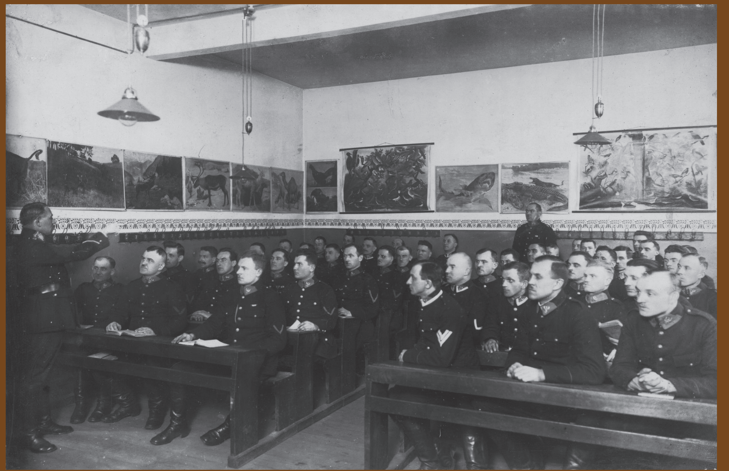
Sala wykładowa szkoły policyjnej w Katowicach, 1923–1925 r.