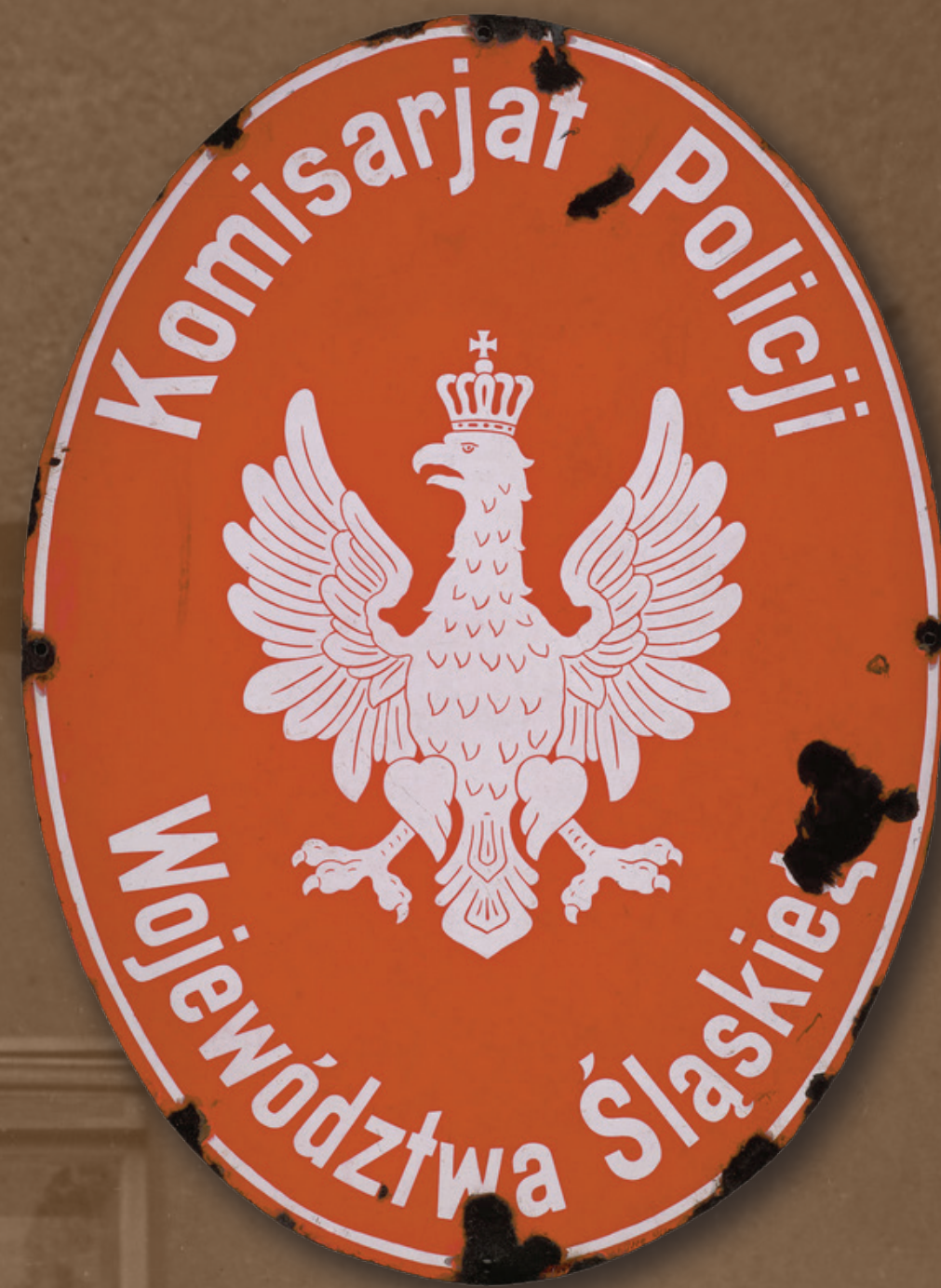
Emaliowany szyld z elewacji zewnętrznej budynku Komisarjatu PWŚl., 1922–1927 (ze zbiorów Muzeum Śląskiego w Katowicach)