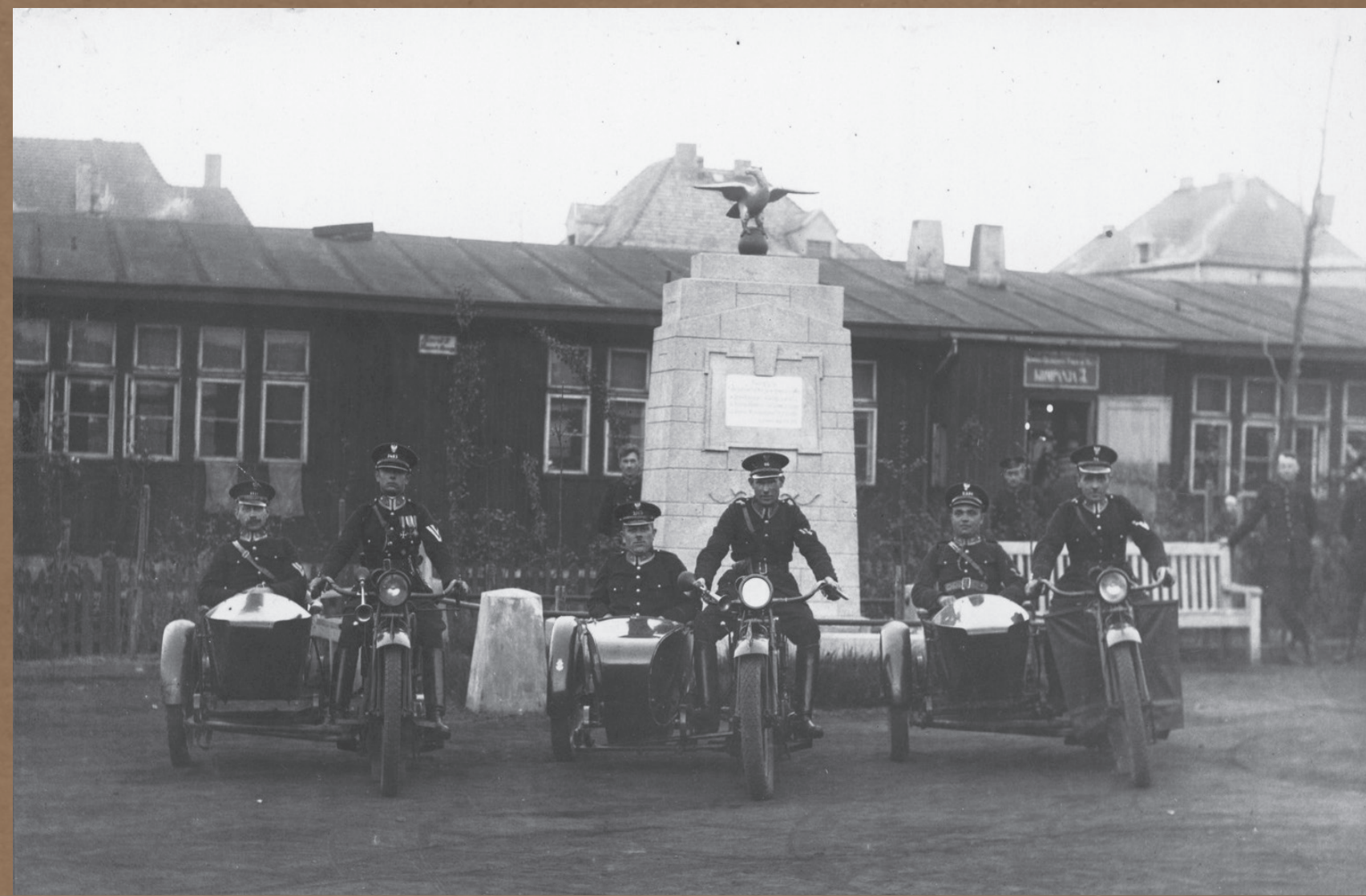
Korpus PWŚI. dysponował zapleczem samochodowym, na które w 1939 r. składały się: 3 samochody pancerne, 12 samochodów osobowych, 5 autobusów, 2 samochody ciężarowe, 7 motocykli i ok. 400 rowerów. Na zdjęciu wyjazd motocyklistów z placu ćwiczeń Komendy Rezerwy PWŚI. w Katowicach

Do końca listopada 1922 r. na granicy z Niemcami i Czechosłowacją na terenie województwa śląskiego kontrolę sprawował Oddział Kontroli Granicznej, podlegający Głównej Komendzie PWŚI. Później służbę tę przejęły właściwe komendy powiatowe. Na fotografii funkcjonariusz przy tramwaju tranzytowym na polsko-niemieckim przejściu granicznym w Łagiewnikach (obecnie dzielnica Bytomia), lata 20.–30. XX w.