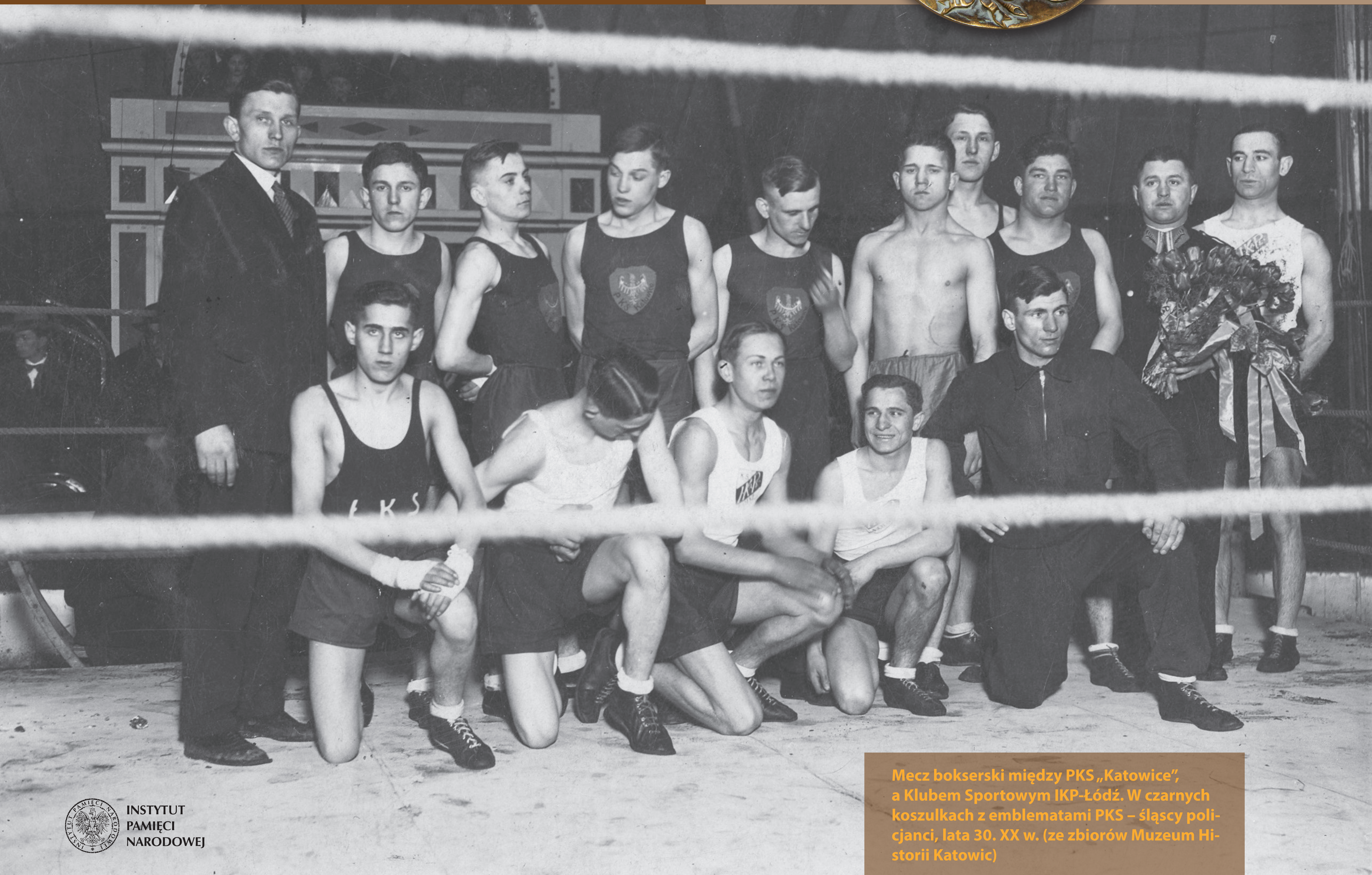
Mecz bokserski między PKS „Katowice”, a Klubem Sportowym IKP-Lódź. W czarnych koszulkach z emblematami PKS – śląscy policjanci, lata 30. XX w.