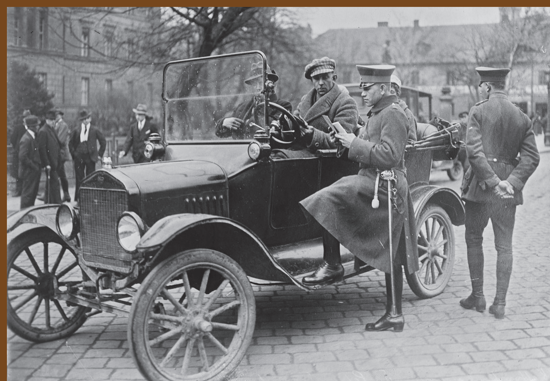
Funkcjonariusze Policji Górnego Śląska, którzy chcieli w przyszłości kontynuować służbę w PWŚl., mogli się poddać weryfikacji i po przeszkoleniu ubiegać się o przyjęcie w jej szeregi. Na zdjęciu policjanci formacji podczas kontroli drogowej w Katowicach, 1920–1922

Prace nad organizacją śląskiej policji rozpoczęły się jeszcze przed III powstaniem śląskim i były kontynuowane po jego zakończeniu w sekcji bezpieczeństwa Wydziału Administracyjnego, a następnie Wydziału Bezpieczeństwa Publicznego Naczelnej Rady Ludowej na Górnym Śląsku, która w tym czasie reprezentowała społeczność polską na obszarze plebiscytowym. W toku prac wzorowano się na ustawie o polskiej Policji Państwowej z 24 lipca 1919 r. Ostatecznie Policję Województwa Śląskiego utworzono na mocy rozporządzenia Województwa Śląskiego z 17 czerwca 1922 r. Dzień wcześniej, rozporządzeniem Międzysojuszniczej Komisji Rządzącej i Plebiscytowej, zdecydowano o rozwiązaniu wszystkich sił policyjnych działających do tej pory na terenie Górnego Śląska: Policji Górnego Śląska, Policji Specjalnej oraz Straży Gminnych.