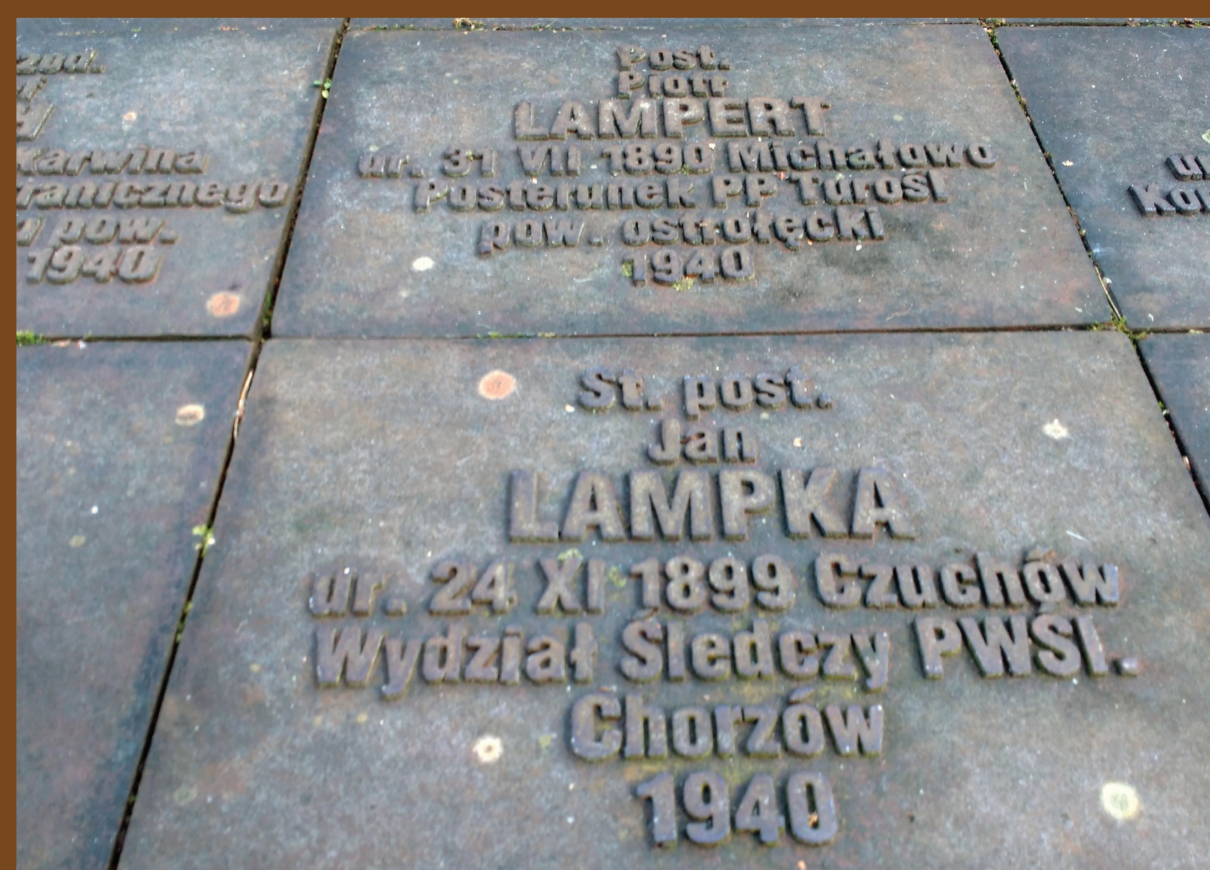
Tabliczki epitafijne na Polskim Cmentarzu Wojennym w Miednoje (ze zbiorów Ogólnopolskiego Stowarzyszenia Rodzina Policyjna 1939 r.)