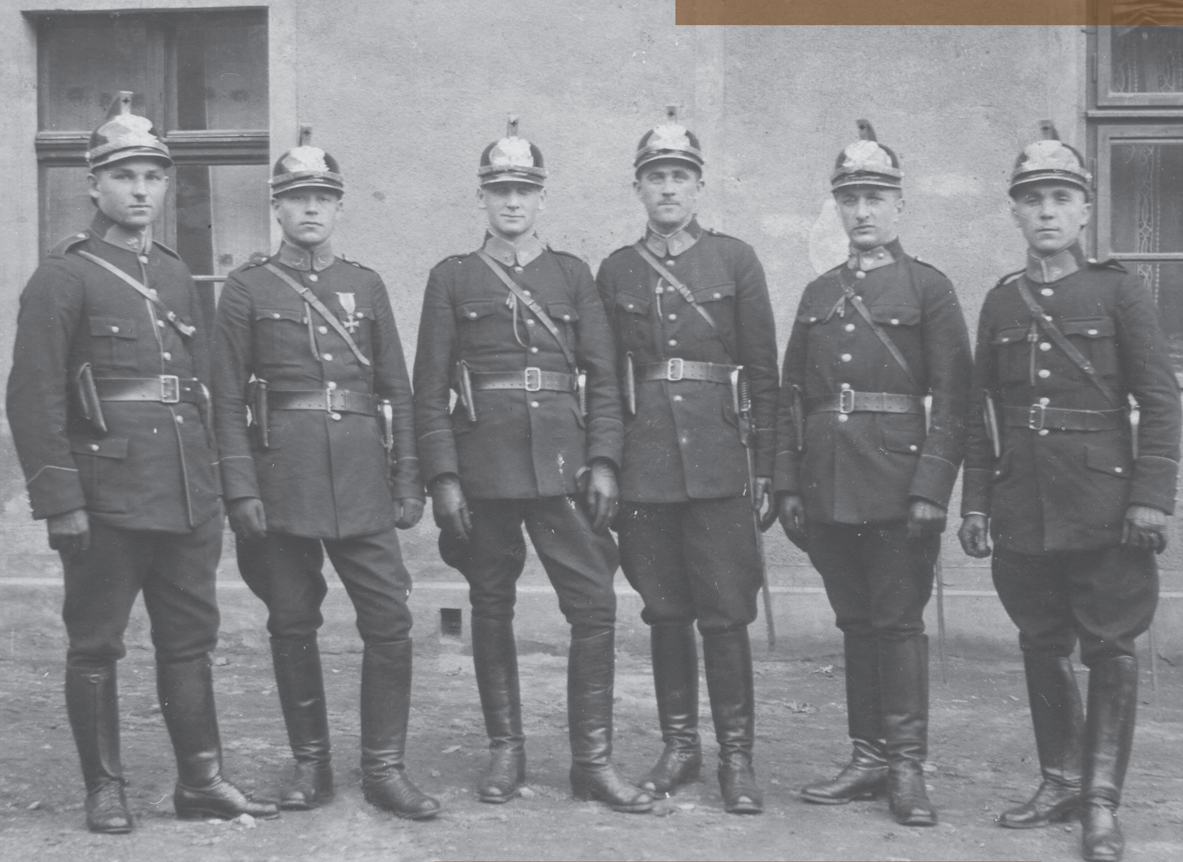
Drużyna Pogotowia z Komisariatu III PWŚI. w Katowicach, w paradnych hełmach szeregowej policji pieszej, 1925 r.