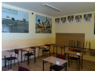
Prywatne Liceum Ogólnokształcące dla Młodzieży w Nowym Targu