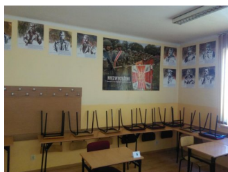
Prywatne Liceum Ogólnokształcące dla Młodzieży w Nowym Targu

Prywatne Liceum Ogólnokształcące dla Młodzieży w Nowym Targu