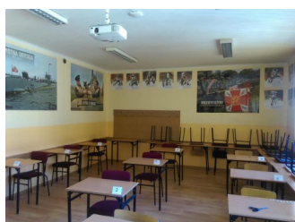
Prywatne Liceum Ogólnokształcące dla Młodzieży w Nowym Targu