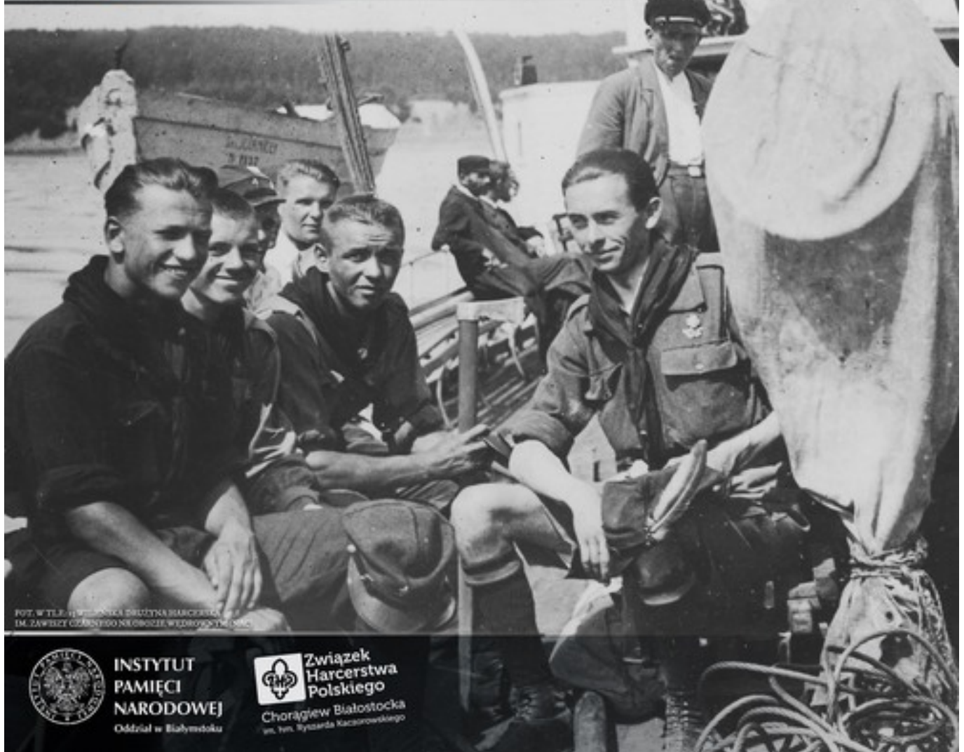
FOT. W TŁE: HARCERSKA DRUŻYNA HARCERZY IM. ZAWSZY CZĘSTO NA OBROTIE WIEDROWEK

OZNACZENIA I SYMBOLIKA PROPORCÓW JEST ŚCIŚLE ZWIĄZANA ZE SPECYFIKĄ DRUŻYNY. NA PROPORCU ZNAJDUJĄ SIĘ CHARAKTERYSTYCZNE OZNACZENIA, W TYM PRZYPADKU LILIJKA HARCERSKA NA ZŁOTEJ KOTWICY – SYMBOL DRUŻYN WODNYCH.