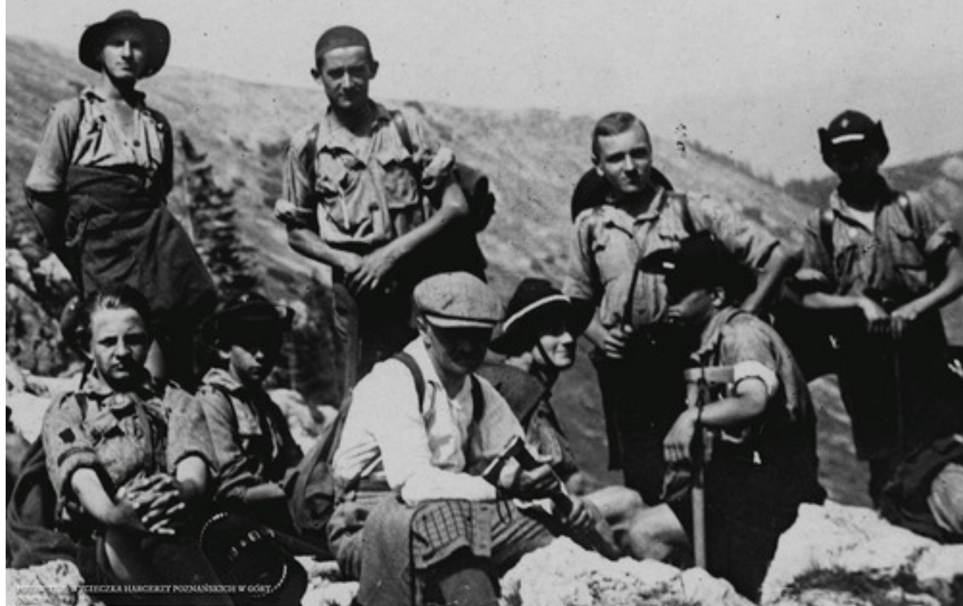
FOTOGRAFIA HARCERZY POZNAJĄCICH SIĘ W OŚCIE