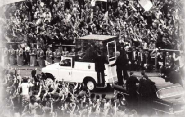
Przejazd papieża Jana Pawła II przez gdańską Zaspę 12 czerwca 1987 r.