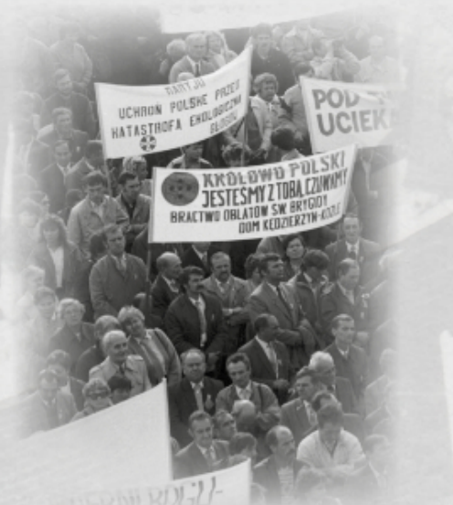
Oblaci z Kędzierzyna-Koźła podczas Pielgrzymki Ludzi Pracy na Jasną Górę w Częstochowie 20 września 1987 r. Fot. Paweł Głanert.

Podstawą działalności Bractwa Oblatów św. Brygidy było integrowanie różnych środowisk wokół wartości wynikających z nauki Kościoła katolickiego, niesienie pomocy bliźnim oraz przeciwdziałanie rozbiciu więzi międzyludzkich i demoralizacji narodu polskiego, wyrażającej się szczególnie w upadku obyczajów, pijaństwie, zakłamaniu i złodziejstwie, a także wyrobienie w członkach bractwa świadomej odwagi koniecznej do występowania w obronie bliźniego i narodu. W swoich działaniach bractwo wzorowało się na stoczniowej Kasie Wzajemnej Pomocy. Organizowało także pielgrzymki, marsze ekologiczne, ochronę mszy za Ojczyznę, straż przy grobie ks. Jerzego Popiełuszki w Warszawie i dni kultury chrześcijańskiej oraz pikietowało sklepy monopolowe w sierpniu. W okresie zdelegalizowania „Solidarności” stanowiło ono namiastkę Związku, stając się punktem kontaktowym dla działaczy związkowych i miejscem kolportażu wydawnictw antykomunistycznych.