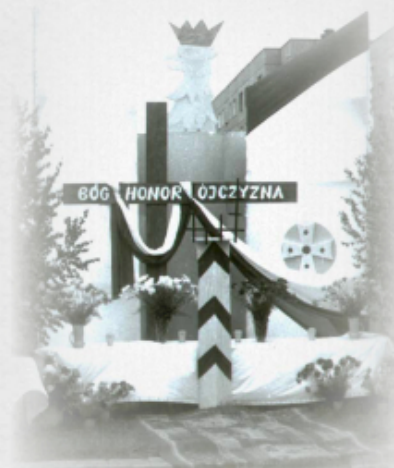
Ołtarz na Boże Ciało wykonany przez Bractwo Oblatów z Głogowa.