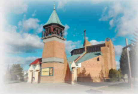
Kościół Najświętszej Maryji Panny Królowej Polski w Głogowie.