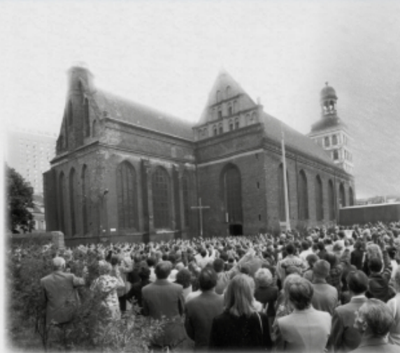
Kościół pw. św. Brygidy w Gdańsku.

15 stycznia 1984 r. powołano Bractwo Oblatów św. Brygidy, a jego pierwsze publiczne wystąpienie nastąpiło podczas procesji Bożego Ciała w tym samym roku.