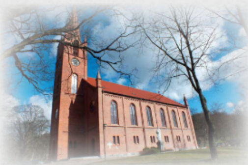
Kościół Najświętszego Serca Jezusowego w Słupsku.