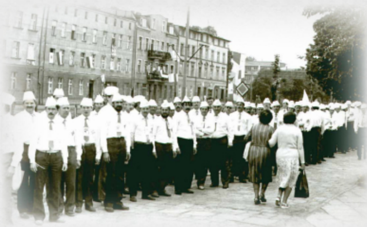
Służba papieska Bractwa Oblatów z Głogowa w czasie pobytu Jana Pawła II w Gdańsku.