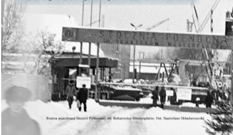
Beama wejściowa Stoczni Północnej im. Bohaterów Westerplatte.

DYREKTOR Wydziału do Spraw Wyznań mgr Edward Pabłocki