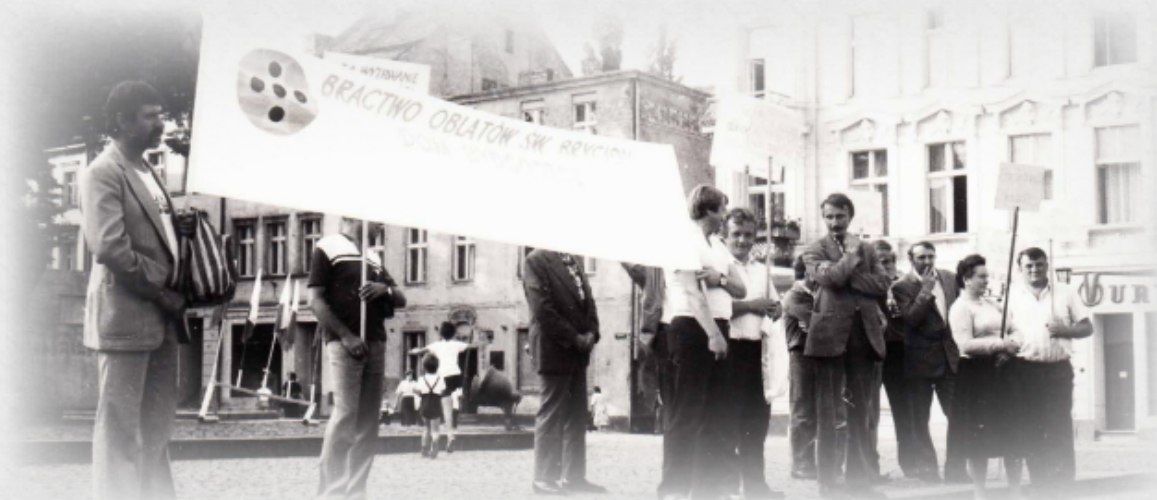
Pikieta sklepów monopolowych na rynku w Bydgoszczy w sierpniu 1985 r.