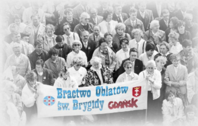
Bractwo Oblatów św. Brygidy w Gdańsku na pielgrzymce Ludzi Pracy na Jasną Górę we wrześniu 1990 r.