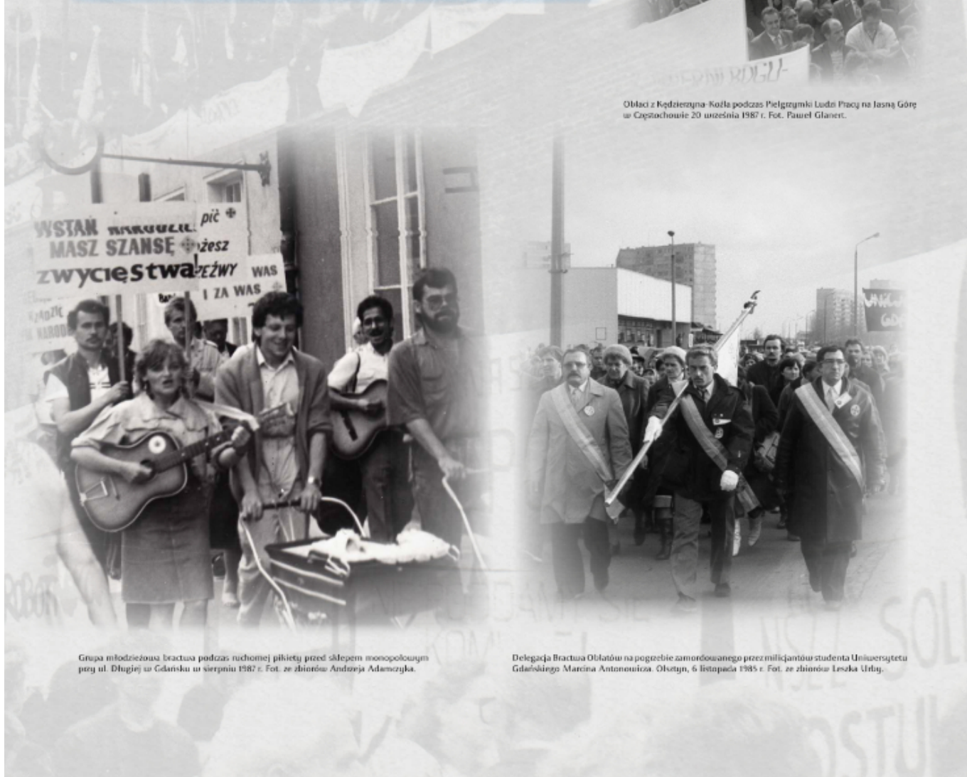
Grupa młodzieżowa bractwa podczas ruchomej pikiety przed sklepem monopolowym przy ul. Długiej w Gdańsku w sierpniu 1982 r.