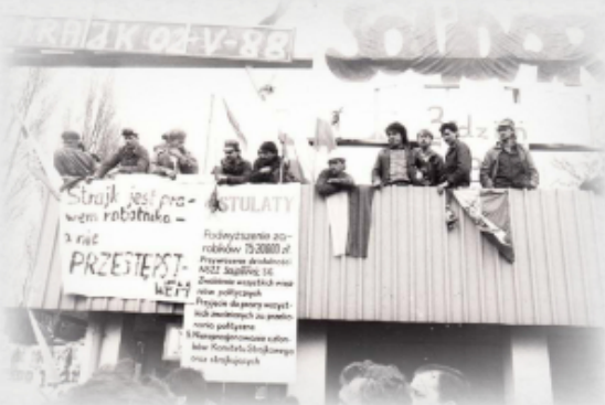
Wśród strajkującej w maju 1988 r. załogi Stoczni Gdańskiej znajdowali się Bracia Oblaci św. Brygidy.