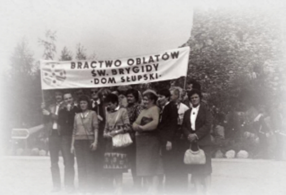
Oblaci ze Słupska w Licheniu w uroczniku 1986 r.