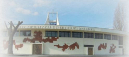
Kościół pw. Świętych Braci Polskich Męczenników w Bydgoszczy. Miejsce ostatniej mszy odprawionej przez ks. Jerzego Popiełuskę.