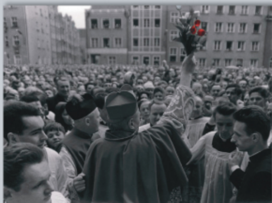
Prymas Stefan Wyszyński witający wiernych zgromadzonych przed bazyliką Mariacką, 1966 r.