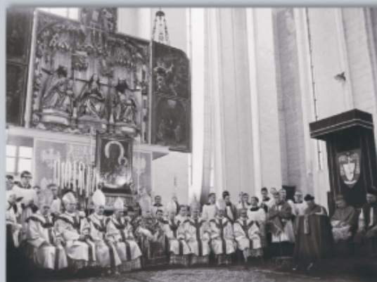
Uroczysta msza św. w bazylice Mariackiej w Gdańsku, 1966 r.