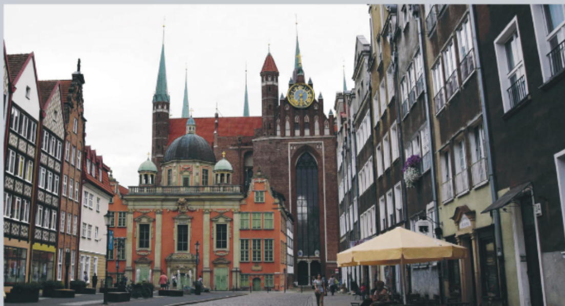
Bazylika Mariacka w Gdańsku od strony Kaplicy Królewskiej