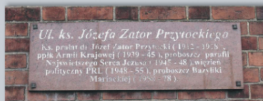
Ulica poświęcona pierwszemu powojennemu administratorowi kościoła Najświętszego Serca Jezusowego w Gdańsku-Wrzeszczu