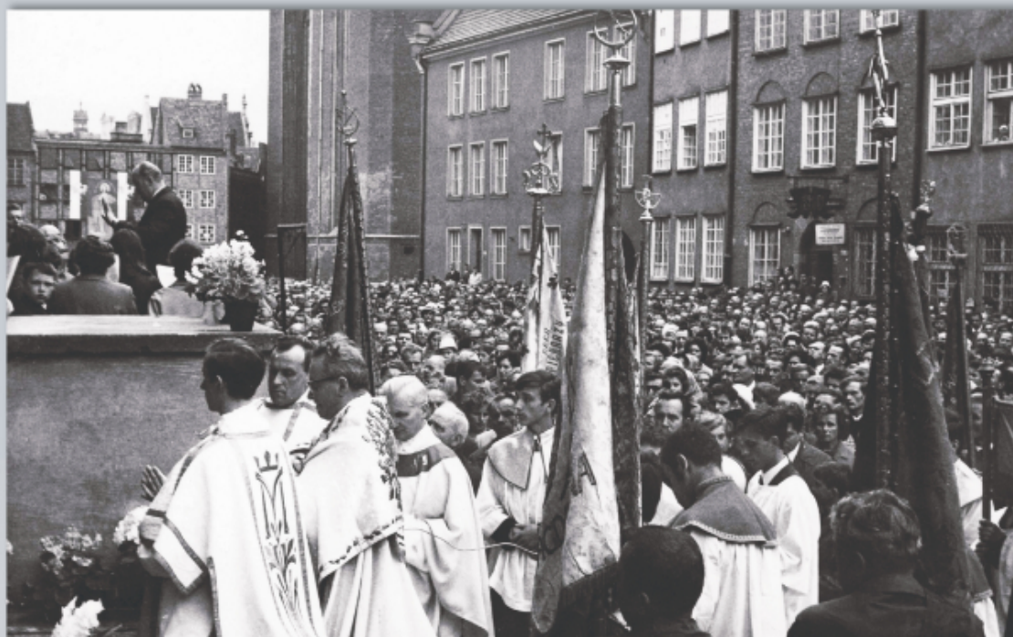
Procesja Bożego Ciała na ulicach Gdańska, lata 60. XX w. (bazylika Mariacka w Gdańsku)