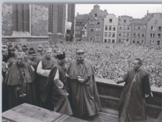
Plac przed bazyliką Mariacką, 1966 r.

29 maja 1966 r. w ramach obchodów Milenium Chrztu Polski w bazylice Mariackiej w Gdańsku odbyła się uroczysta msza św. z udziałem prymasa Polski kard. Stefana Wyszyńskiego oraz wielu biskupów. W odpowiedzi na uroczystości organizowane przez Kościół katolicki uroczystości komunistyczne władze zorganizowały „konkurencyjne” obchody Tysiąclecia Państwa Polskiego, starając się umniejszyć wartość kościelnych obchodów. Uroczystości milenijne zgromadziły na placu przed bazyliką Mariacką w Gdańsku tysiące wiernych pragnących pokazać swą jedność z Kościołem katolickim, a jednocześnie wyrazić swój sprzeciw wobec polityki władz państwowych w stosunku do Kościoła. Po zakończeniu ceremonii doszło do antykomunistycznej manifestacji, która pociągnęła za sobą liczne aresztowania i surowe wyroki.