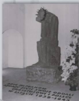
Kaplica Kapłańska z rzeźbą Chrystusa Frasobliwego poświęcona ponad 2 tys. kapłanów pomordowanych w czasie II wojny światowej. Lata 60. XX w.