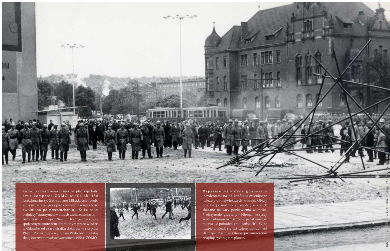
Intervencja ZOMO w Gdańsku, 29 maja 1966 r. (fot. NN)

Krótko po zniszczeniu plansz na plac zajęły dwie kompanie ZOMO w sile ok. 150 funkcjonariuszy. Zatrzymano kilkadziesiąt osób, w tym wiele przypadkowych (większość zwolniono po przesłuchaniu). Kilka osób „tajniacy” zatrzymali w innych częściach miasta. Incydent z maja 1966 r. był pierwszym społecznym protestem stłumionym przez władze w Gdańsku od czasu strajku dokerów w sierpniu 1946 r. Po raz pierwszy też na Wybrzeżu na taką skalę interweniowało utworzone w 1956 r. ZOMO.