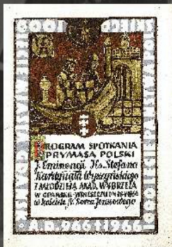
Wieczorem 28 maja 1966 r. w kościele akademickim „na Czarniej” we Wrzeszczu odbyło się nabożeństwo dla studentów Trójmiasta. Obok kardynała Stefana Wyszyńskiego uczestniczyło w nim kilku biskupów, w tym arcybiskup Karol Wojtyła.