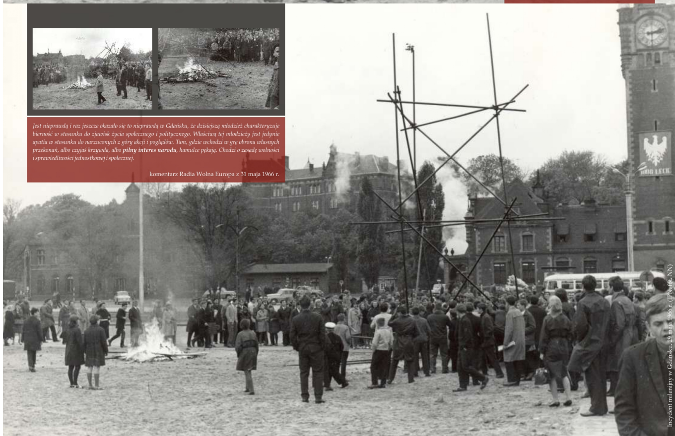
Incydent milenijny w Gdańsku, 29 maja 1966 r.

komentarz Radia Wolna Europa z 31 maja 1966 r.