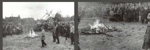
Incydent milenijny w Gdańsku, 29 maja 1966 r.

Jest nieprawdą i raz jeszcze okazało się to nieprawdą w Gdańsku, że dzisiaj młodzież charakteryzuje bierność w stosunku do zjawisk życia społecznego i politycznego. Właściwą tej młodzieży jest jedynie apatia w stosunku do narzuconych z góry akcji i poglądów. Tam, gdzie wchodzi w grę obrona własnych przekonań, albo czyjaś krzywda, albo pilny interes narodu, hamulce pękają. Chodzi o zasadę wolności i sprawiedliwości jednostkowej i społecznej.