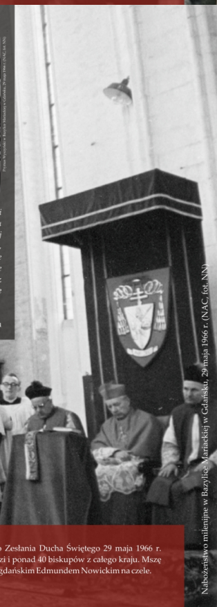
Prymas Polski Stefan Wyszyński w Gdańsku