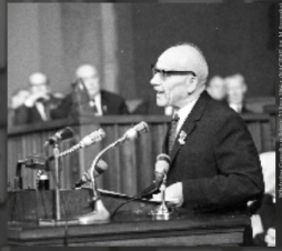
Obchodom tysiąclecia powinniśmy nadać nie klerikalny, lecz nasz, ludowy charakter. I sekretarz KC PZPR Władysław Gomułka (1958)