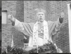
Dziesięćlecie przygotowanie do Milenium winno całą Polskę przeobrazić teocentrycznie. Los komunizmu rozstrzygnie się w Polsce. Jak Polska się uchrześcijani, słanie się wielką siłą moralną, komunizm sam przez się upadnie. Prymas Polski kardynał Stefan Wyszyński (1960)