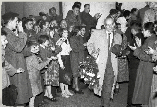
◀ Władysław Gomułka oklaskiwany przez zgromadzonych na placu Defilad w Warszawie, 24 października 1956 r.

EN | In October 1956, rallies of support were held in Poland for Władysław Gomułka, who returned to politics in August. He was widely perceived as a victim of the Stalinist period, because in 1951 he was arrested as a result of friction in the authorities of the Polish People's Republic. On 21st October 1956, Gomułka became the First Secretary of the Central Committee of the Polish United Workers' Party. He presented to Polish society a programme of moderate political and economic reforms. Most importantly, he gave Poles hope for a better life, so he could count on a lot of support. Earlier, due to Nikita Khrushchev's dissatisfaction with the political situation, Poland was threatened with the intervention of the Northern Group of the Soviet Army, whose units moved from bases in Lower Silesia and Western Pomerania towards Warsaw and stopped 100 km from the capital. The Soviet army was ready to attack Poland. They returned to their bases only after the outbreak of the Hungarian Revolution. Miraculously, bloodshed was avoided. Ultimately, Khrushchev agreed to elect Gomułka as the first secretary of the Central Committee of the Polish United Workers' Party.