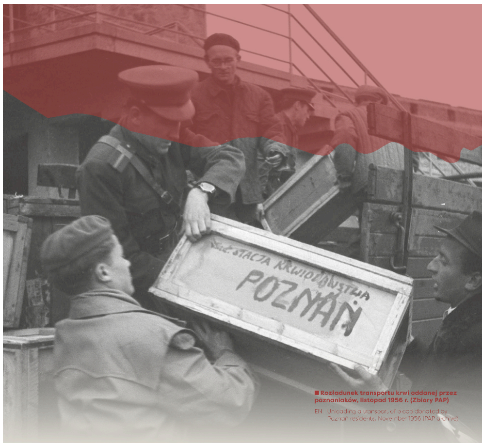
■ Rozładunek transportu krwi oddanej przez poznańców, listopad 1956 r.

EN Unloading a consignment of blood donated by Poznań residents, November 1956