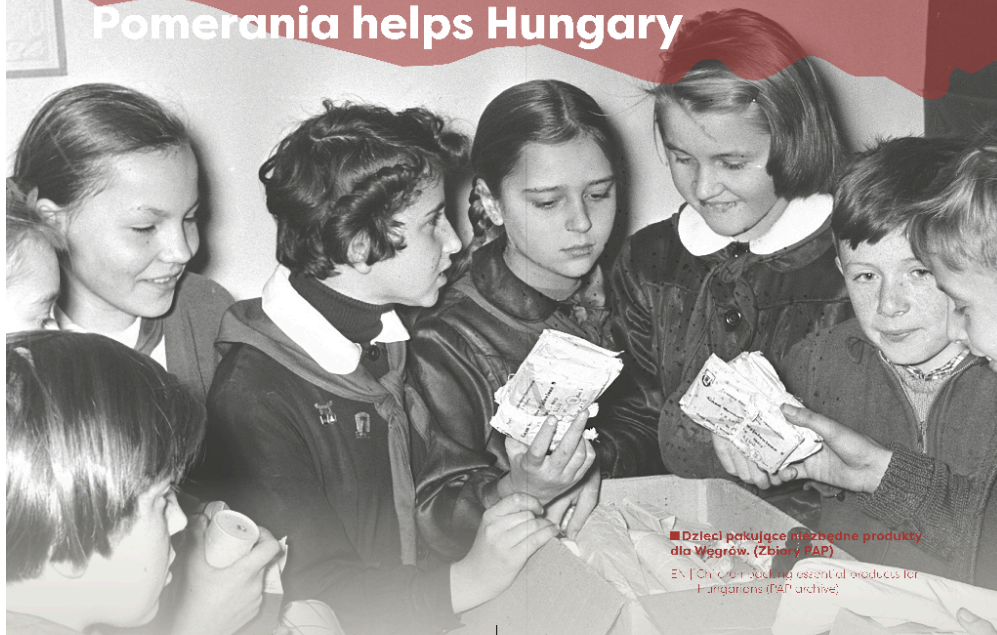
■ Dzieci pakujące niezbędne produkty dla Węgrów.

EN | Children packing essential products for Hungarians