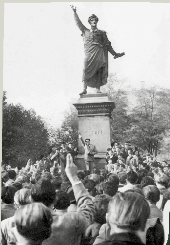
◀ Protestujący Węgrzy pod pomnikiem Sándora Petőfięgo.

EN | On 23rd October 1956, Hungarian students organized a rally to support Polish political changes. The demonstration began on the square at the monument of the Polish-Hungarian 1848 hero gen. Józef Bem under the slogan "All Hungarians, come with us, we will follow the Poles!". The Hungarian communist authorities asked for the intervention of the Soviet army. After the initial success of the insurgents, the Hungarian communists again summoned the armed forces of the USSR, which entered Budapest for the second time on 4th November 1956. The government of János Kádár was elected, who dealt with his predecessors, i.e. Prime Minister Imre Nagy and his closest associates were executed.