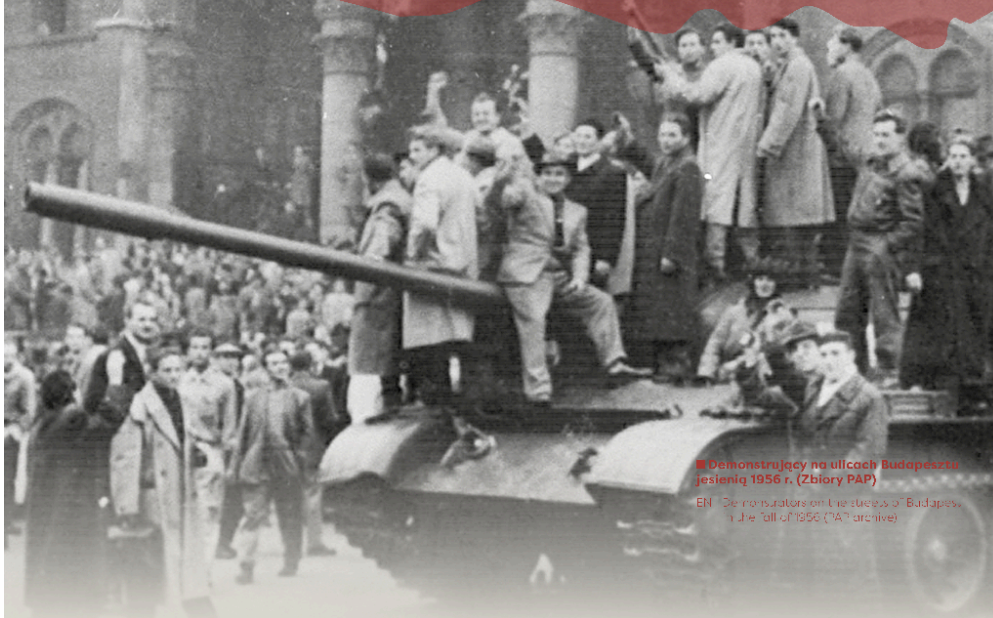
◀ Demonstrujący na ulicach Budapesztu jesienią 1956 r.

EN | Demonstrators on the streets of Budapest, fall of 1956