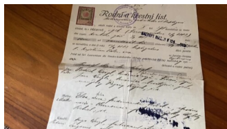
Austriak z pochodzenia, Polak z wyboru_Moment 2