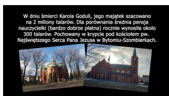
Kadr z filmu o Karolu Goduli