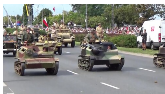
Kadr z filmu o tankietce