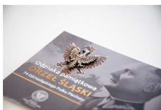
Odnaka pamiątkowa "Orzeł śląski 74 Górnośląskiego Pułku Piechoty"