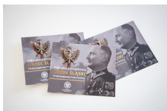
Odnaka pamiątkowa "Orzeł śląski 74 Górnośląskiego Pułku Piechoty"