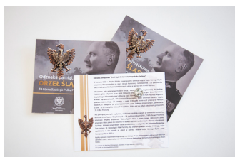
Odnaka pamiątkowa "Orzeł śląski 74 Górnośląskiego Pułku Piechoty"