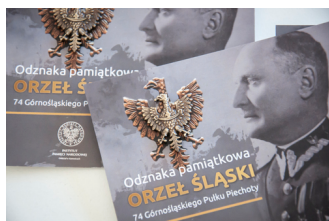
Odnaka pamiątkowa "Orzeł śląski 74 Górnośląskiego Pułku Piechoty"