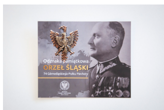
Odnaka pamiątkowa "Orzeł śląski 74 Górnośląskiego Pułku Piechoty"