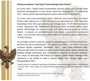
Blister odznaki Orzeł śląski 74 Górnos Śląskiego Pułku Piechoty-2