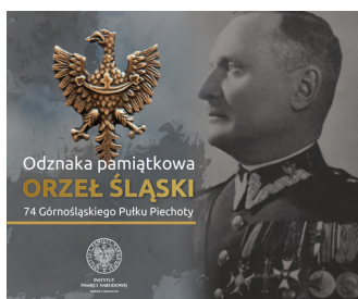
Blister odznaki Orzeł śląski 74 Górnośląskiego Pułku Piechoty-1

Na pamiątkę tamtych wydarzeń, rozkazem opublikowanym w Dzienniku Rozkazów Ministerstwa Spraw Wojskowych z 29 października 1929 r., 74 Pułkowi Piechoty przyznano oficjalny przydomek "Górnośląski". Wraz z nową nazwą żołnierzom pułku przyznano także prawo do noszenia na łapkach kurtek mundurowych i płaszczy odznaki orła śląskiego, którego zatwierdzony wzór zamieszczono w załączniku do Dziennika Rozkazów. Tym samym 74 Górnośląski Pułk Piechoty był jedynym pułkiem Wojska Polskiego, który wyróżniono w ten sposób za udział w operacji objęcia części Górnego Śląska przez Rzeczypospolitą w 1922 r.