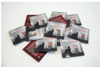
Przypinka upamiętniająca 80. rocznicę bitwy o Monte Cassino

Przypinka została wydana z okazji 80. rocznicy bitwy o Monte Cassino przez Oddziałowe Biuro Edukacji Narodowej Instytutu Pamięci Narodowej w Katowicach. Umieszczono na niej charakterystyczne elementy, które w pamięci społecznej stały się symbolem tej bitwy: czerwone maki oraz powiewającą z ruin klasztoru flagę. Towarzyszy jej kartonik, na którym umieszczono tekst objaśniający kontekst wydania znaczka.