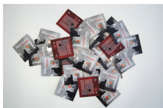
Przypinka upamiętniająca 80. rocznicę bitwy o Monte Cassino