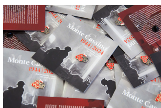
Przypinka upamiętniająca 80. rocznicę bitwy o Monte Cassino