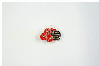
Przypinka upamiętniająca 80. rocznicę bitwy o Monte Cassino