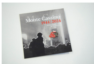
Przypinka upamiętniająca 80. rocznicę bitwy o Monte Cassino, fot. Aleksandra Koroń-Chudy / IPN