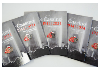
Przypinka upamiętniająca 80. rocznicę bitwy o Monte Cassino, fot. Aleksandra Koroń-Chudy / IPN