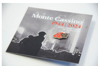
Przypinka upamiętniająca 80. rocznicę bitwy o Monte Cassino