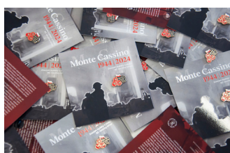
Przypinka upamiętniająca 80. rocznicę bitwy o Monte Cassino, fot. Aleksandra Korol-Chudy / IPN