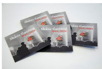
Przypinka upamiętniająca 80. rocznicę bitwy o Monte Cassino, fot. Aleksandra Koroń-Chudy / IPN