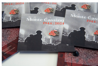
Przypinka upamiętniająca 80. rocznicę bitwy o Monte Cassino, fot. Aleksandra Koroń-Chudy / IPN