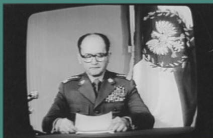
Gen. Wojciech Jaruzelski ogłasza stan wojenny. W swojej wypowiedzi informuje, że władze w państwie przejęła Wojskowa Rada Ocalenia Narodowego, 13 grudnia 1981 r.