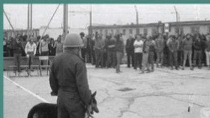
Protest internowanych w ośrodku odosobnienia w Kwilczyńcu, 14 sierpnia 1982 r.

Internowanie – na podstawie decyzji administracyjnych komendantów wojewódzkich Milicji Obywatelskiej, a nie wyroków sądów – było nową, po raz pierwszy na tak szeroką skalę zastosowaną represją. Do ośrodków odosobnienia (zwanymi internatami) trafiali głównie działacze opozycji. Tej formie represji poddano blisko 10 tys. osób (m.in. przewodniczącego związku Lecha Wałęsę), w tym ponad tysiąc kobiet. Byli to głównie ludzie młodzi – najmłodszy internowany miał 17 lat – w zdecydowanej większości mieszkańcy miast. Na przełomie 1982 r. i 1983 r. władze zastosowały też „inteligentną” formę internowania, czyli kierowanie działaczy opozycji – głównie pod pozorem ćwiczeń – do wojska. Tej formie represji poddano ponad 1700 osób.