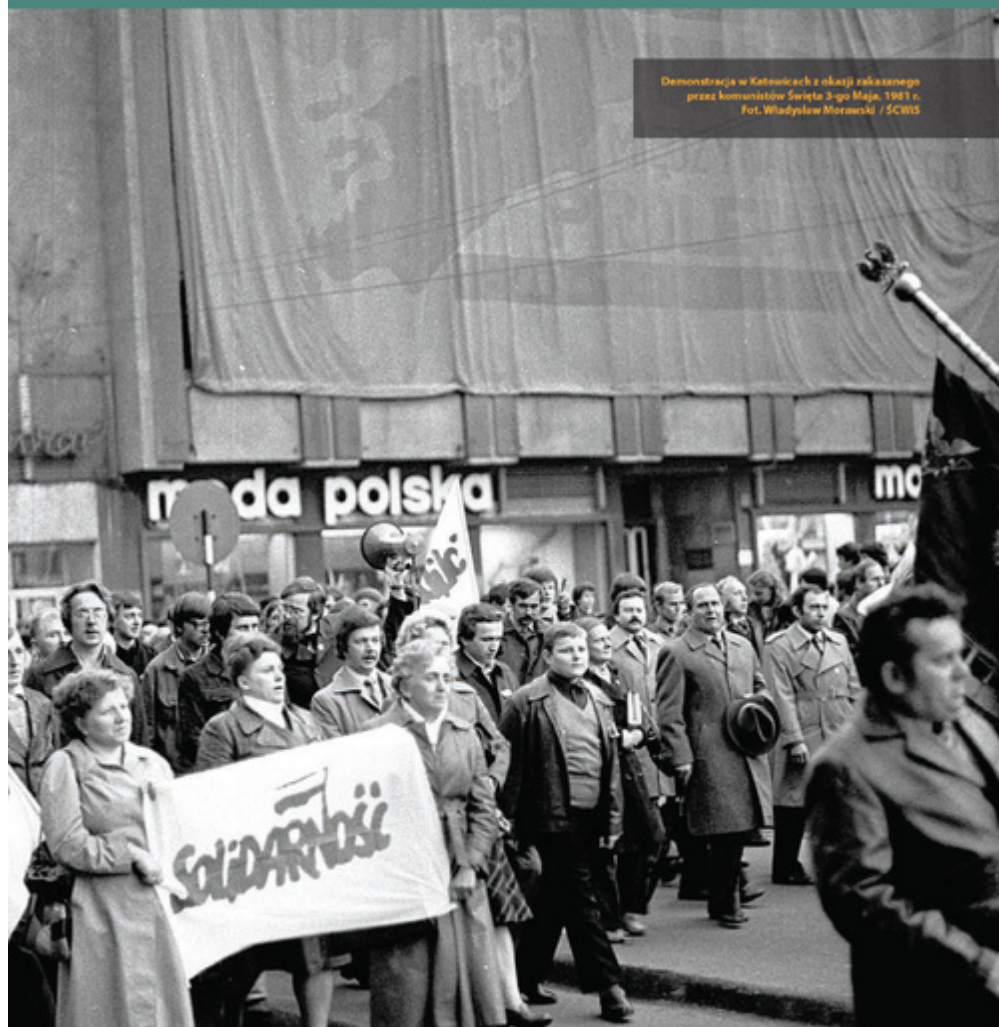
Demonstracja w Katowicach z okazji zakazanego przez komunistów Święta 3-go Maja, 1981 r.

został wprowadzony w nocy z 12 na 13 grudnia 1981 r. Na ulice miast wyprowadzono wojsko i milicję. Wiele zakładów pracy zmilitaryzowano, część z nich (m.in. radio i telewizję) zajęło wojsko. Wylączono telefony, wprowadzono godzinę milicyjną i cenzurę korespondencji, zamknięto granice. Związki zawodowe i inne niezależne organizacje najpierw zawieszono, a następnie zdelegalizowano. Wielu ich działaczy internowano lub aresztowano.