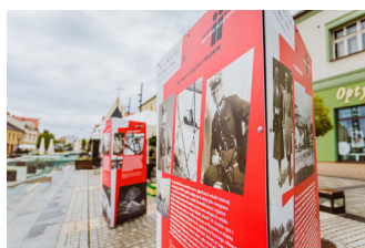
Wernisaż wystawy "Żwirko i Wigura - duet asów"

Opracowanie komputerowych modeli samolotów: Tomasz Sadzinica