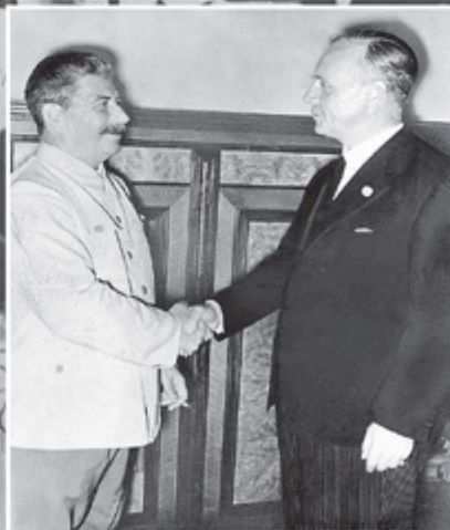
Spotkanie Józefa Stalina i Joachima von Ribbentropa, Moskwa, 23 sierpnia 1939 r.

„Sowieci wkroczyli. (...) Z Sowiecami nie walczyć, tylko w razie (natarcia) z ich strony lub próby rozbrojenia naszych oddziałów”.