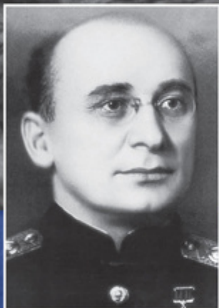
Szef NKWD Ławrientij Beria

Od 1939 r. Beria był Ludowym Komisarzem Spraw Wewnętrznych ZSRR. 19 września tego roku powołał Zarząd do Spraw Jeńców Wojennych i Internowanych przy NKWD oraz nakazał utworzenie sieci obozów. Jako szef NKWD Beria nadzorował sowieckie wywiady kontrwywiad, był odpowiedzialny za pracę Gulagu – sieci sowieckich obozów pracy przymusowej, a także za represje wobec setek tysięcy obywateli polskich, zamieszkujących w latach 1939–1941 tereny Rzeczypospolitej włączone do Związku Sowieckiego.