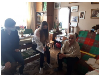
Żywa lekcja historii