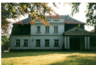
Miejsce pamięci Polanka Hallera