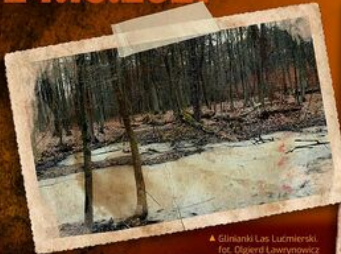
▲ Glinianki Las Łuźmierski, fot. Dłglerd Lawrynowicz