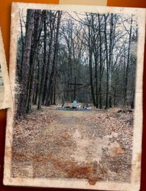
▲ Las Łuźmierski