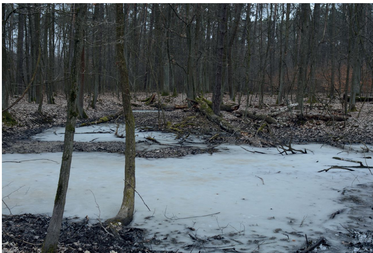
Las Lućmierski (wiosna 2018), fot. Olgierd Ławrynowicz

Egzekucji w ramach „Intelligenzaktion” dokonywano od 12 listopada 1939 r. do wiosny 1940 r. w podłódzkich lasach: Lućmierskim, Łagiewnickim, Wiączyńskim, Okręglik, a także na terenie poligonu wojskowego na Brusie w Łodzi.