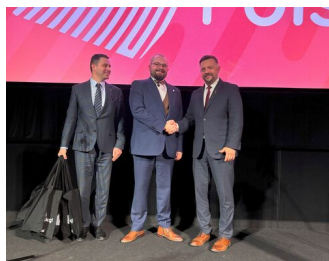
Fot. Anna Józwik