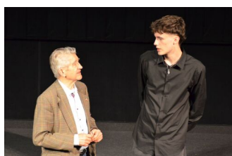
Fot. Maciej Błaszczyk