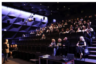
Fot. Grzegorz Nawrot