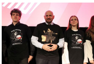
Fot. Anna Józwik