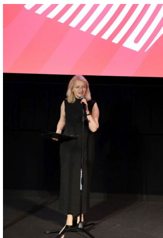
Fot. Grzegorz Nawrot