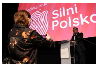
Fot. Grzegorz Nawrot