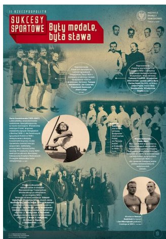
SPORT III RP9-r