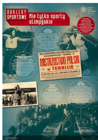
SPORT II RP10-r

Zaczęły wyłaniać się liczne gwiazdy sportu, które swoimi osiągnięciami wzbudzały podziw i zachwyt wśród społeczeństwa. Wówczas redakcja „Przeglądu Sportowego” od 1926 r. zaczęła organizować plebiscyt na najlepszego sportowca w Polsce, który odbywa się do dnia dzisiejszego, a w rankingu wyłanianych jest dziesięciu najlepszych sportowców.