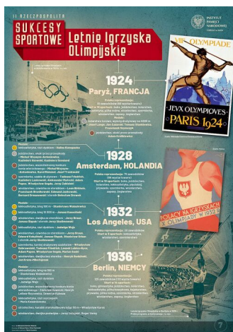
SPORT III RP7-r