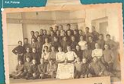
Polskie Towarzystwo Gimnastyczne „Sokół” w Smoleńsku, ok. 1930 r.

Hasła w imię którego „Sokół” dążył do rozwoju sił fizycznych