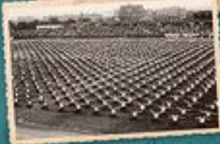
Damy ogólnopolski zlot Towarzystwa Gimnastycznego „Sokół” w Katowicach, 1937 r.

20-22 września 1918 r. I ZJAZD POLSKICH ZRZESZEŃ SPORTOWYCH I GIMNASTYCZNYCH