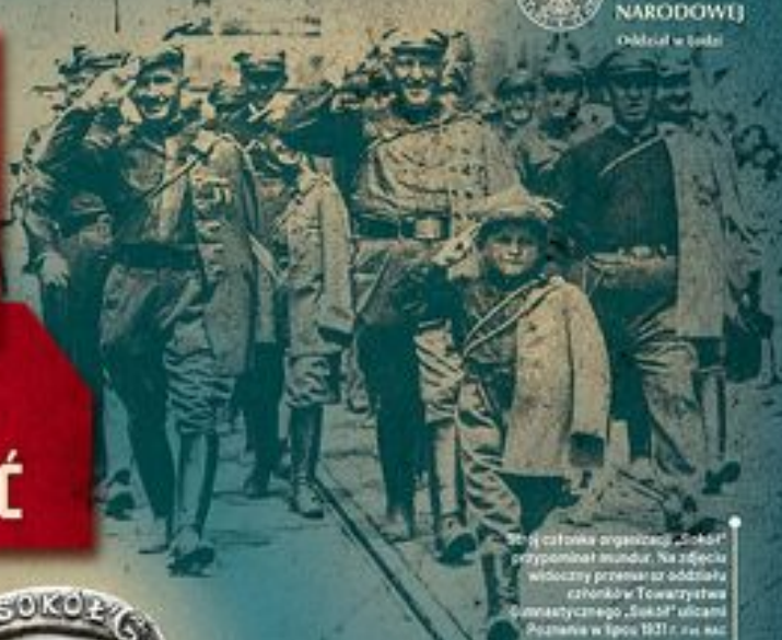
W tej części organizacji „Sokół” przypominał mundur. Na zdjęciu widoczny przemarsz oddziału członków Towarzystwa Gimnastycznego „Sokół” ulicami Poznania w lipcu 1931 r.

INSTYTUT PAMIĘCI NARODOWEJ Oddział w Łodzi