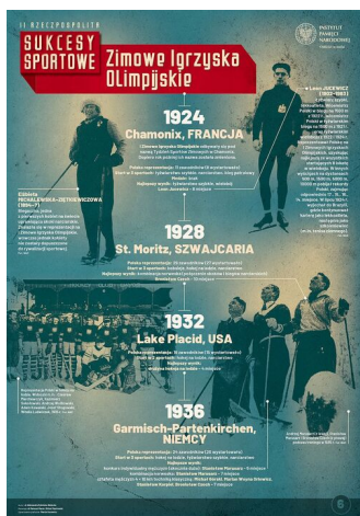
SPORT III RP6-r