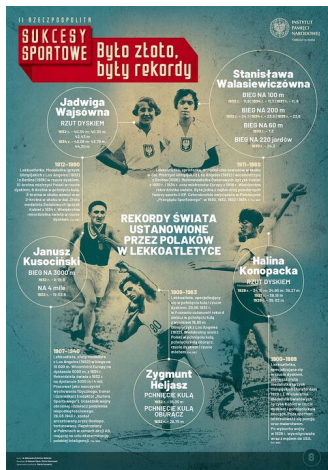
SPORT III RP8-r