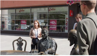
fot. Marzena Kumosińska