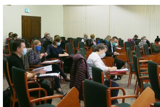
fot. z warsztatów Magdalena Zapolska- Downar