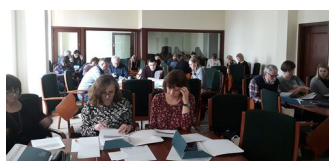
fot. z warsztatów Magdalena Zapolska- Downar

Klauzula informacyjna dotycząca przetwarzania danych osobowych w związku z uczestnictwem w wydarzeniu organizowanym przez Instytut