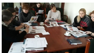
fot. z warsztatów Magdalena Zapolska- Downar