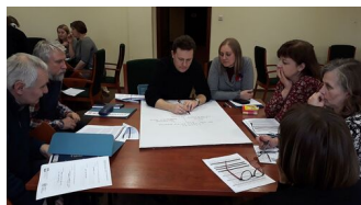
fot. z warsztatów Magdalena Zapolska- Downar