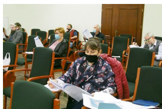
fot. z warsztatów Magdalena Zapolska- Downar