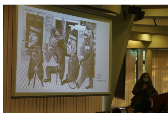
fot. z warsztatów Magdalena Zapolska- Downar