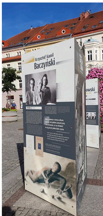
Prezentacja wystawy „Pokolenie Baczyńskiego”