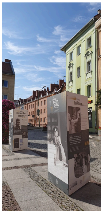
Prezentacja wystawy „Pokolenie Baczyńskiego”