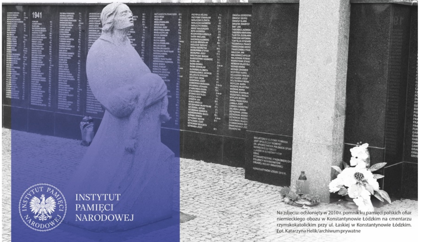
Na zdjęciu: odsłonięty w 2010 r. pomnik ku pamięci polskich ofiar niemieckiego obozu w Konstancinowie Łódzki na cmentarzu rzymskokatolickim przy ul. Łaskiej w Konstancinowie Łódzki.