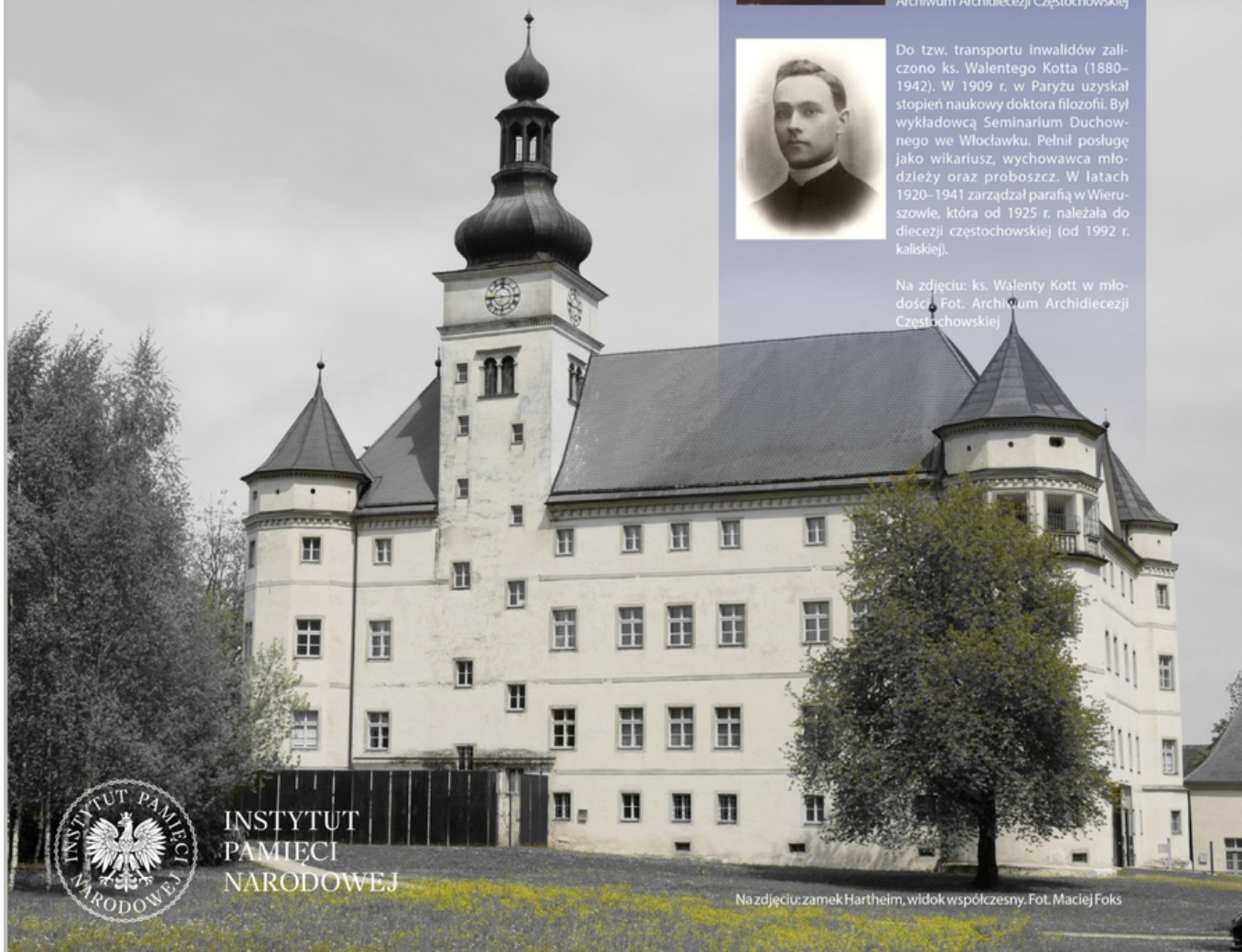
Na zdjęciu: zamek Hartheim, widok współczesny.