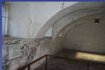
Na zdjęciu: krematorium w Hartheim, widok współczesny.

Więźniowie KL Dachau, którzy przeżyli doświadczenia pseudomedyczne, najczęściej ginęli w tzw. transportach inwalidów. Zabijano ich przy wykorzystaniu komory gazowej w zamku Hartheim w anektowanej przez III Rzeszę w marcu 1938 r. Austrii, stanowiącego jeden z niemieckich nazistowskich ośrodków pozbawiania życia w ramach programu eutanazji, realizowanego w latach 1939–1944 pod kryptonimem Akcja T4. W analogiczny sposób uśmierceni byli więźniowie starsi, chorzy i niemogący pracować, których uprzednio zapewniano o wyjeździe m.in. do placówek opieki. Perspektywa opuszczenia obozu zachęcała niektórych do symulowania dolegliwości, co w rzeczywistości oznaczało skierowanie ich do grupy inwalidów.