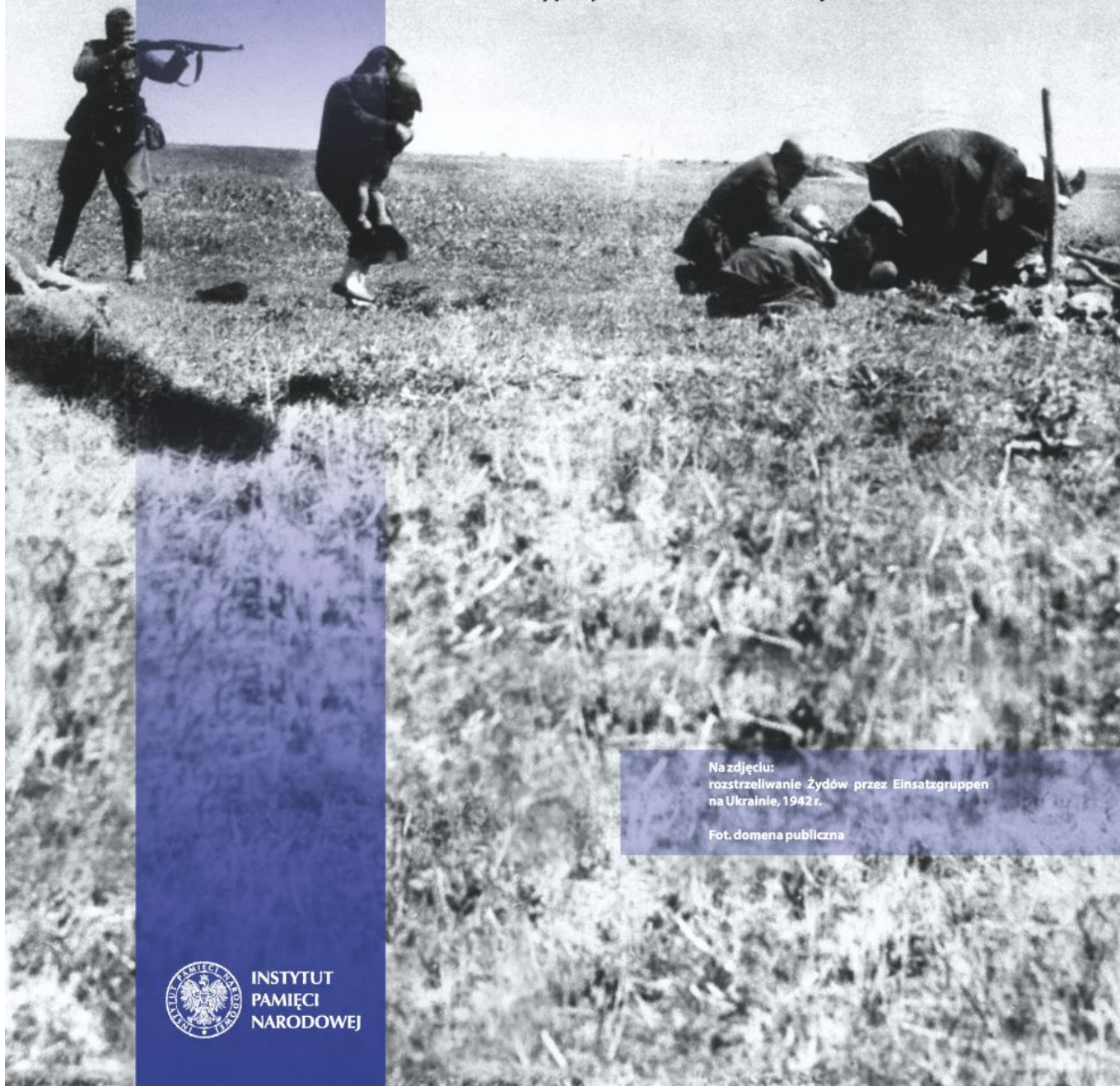
Na zdjęciu: rozstrzeliwanie Żydów przez Einsatzgruppen na Ukrainie, 1942 r.

Rok później przystąpiono do eksterminacji polskich Romów w Generalnym Gubernatorstwie. Większość z nich została rozstrzelana w trakcie obław na wędrujące tabory i osady romskie. Szacuje się, że Niemcy przeprowadzili ok. 200 takich akcji.