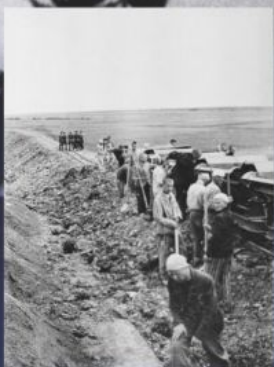
Na zdjęciu: więźniowie obozu koncentracyjnego KL Buchenwald podczas pracy przy budowie linii kolejowej, 1943.