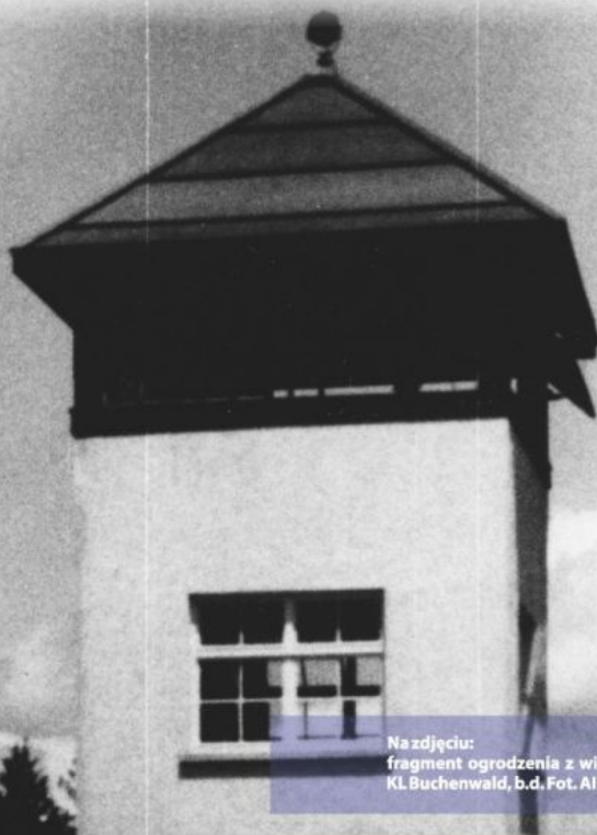
Na zdjęciu: fragment ogrodzenia z wieżą wartowniczą KL Buchenwald, b.d.

Fale kolejnych aresztowań i deportacji Romów i Sinti do obozów koncentracyjnych były następstwem zaostrożającego się prawa, teoretycznie wymierzonego w osoby uchylające się od pracy, ale w praktyce dotykające Romów bez względu na zatrudnienie. Równocześnie rozpoczęto politykę ich przymusowej sterylizacji, której poddano m.in. wszystkie romskie więźniarki Ravensbrück - największego obozu kobiecego w III Rzeszy.