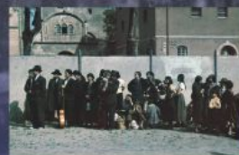
Na zdjęciu: niemieccy Romowie i Sinti w oczekiwaniu na deportację do Generalnego Gubernatorstwa. Za nielegalny powrót do Niemiec groziła im sterylizacja i umieszczenie w obozie koncentracyjnym. Oboz zbiorczy w Asperg (Niemcy), 1940 r.