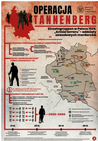
3. „Armia terroru” – oddziały zawodowych morderców