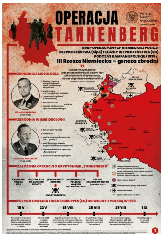
1. III Rzesza Niemiecka – geneza zbrodni

Operacja „Tannenberg”, przeprowadzona w 1939 r. w Polsce przez niemieckie grupy operacyjne Einsatzgruppen, była pierwszą zaplanowaną na masową skalę operacją eksterminacyjną w okresie II wojny światowej. Jej celem było wyeliminowanie polskich warstw przywódczych, w większości wpisanych przed wojną na tzw. listy proskrypcyjne. Do końca 1939 r. Niemcy na terenach okupowanych przez III Rzeszę zamordowali około 55 000 polskich obywateli, głównie Powstańców Wielkopolskich, Powstańców Śląskich, członków Polskiego Związku Zachodniego, nauczycieli, księży, urzędników, ziemian i chłopów. Infografika w przejrzysty sposób przedstawia etap przygotowań do operacji, jej zbrodnicze założenia, formowanie i skład Einsatzgruppen, jej przebieg, wyjątkowy charakter oraz miejsca masowych zbrodni dokonanych przez Niemców w 1939 r.