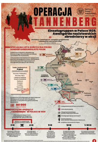
2. Awangarda nazistowskich zbrodniarzy