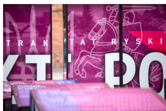
Gorzki pokój. Traktat ryski 1921 r. wystawa IPN na dziedzińcu Zamku Królewskiego w Warszawie.