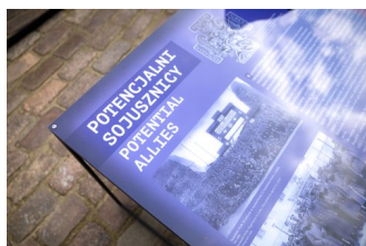
Gorzki pokój. Traktat ryski 1921 r. wystawa IPN na dziedzińcu Zamku Królewskiego w Warszawie.