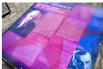
Gorzki pokój. Traktat ryski 1921 r. wystawa IPN na dziedzińcu Zamku Królewskiego w Warszawie.