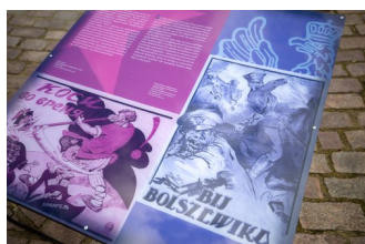
Gorzki pokój. Traktat ryski 1921 r. wystawa IPN na dziedzińcu Zamku Królewskiego w Warszawie.