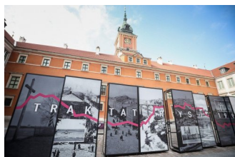
Gorzki pokój. Traktat ryski 1921 r. wystawa IPN na dziedzińcu Zamku Królewskiego w Warszawie.