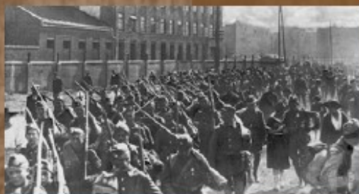
Wymarsz warszawskiej młodzieży gimnazjalnej na front. Warszawa-Praga, sierpień 1920 r.

Żołnierze Armji Ochotniczej! (...) Przyszła zatem teraz kolej na Was, którzy jako ochotnicy, wspomóż pragniecie Armję czynną i wspólnie z nią chcecie walczyć. Powstałiście dla obrony ziem Polskich, dla obrony życia i mienia obywateli, dla obrony wolności i najświętszych ideałów Polski przed zalewem barbarzyństwa i nieubłaganej zemsty nad naszą Ojczyzną. (...)