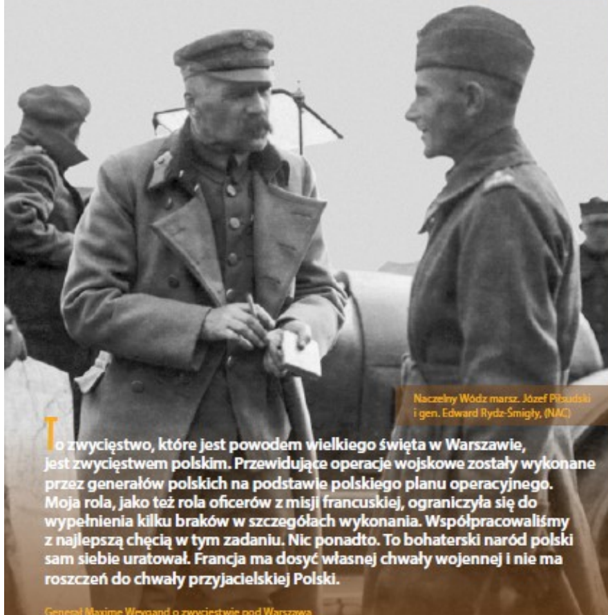
Naczelnny Wódz marsz. Józef Piłsudski i gen. Edward Rydz-Śmigły

To zwycięstwo, które jest powodem wielkiego święta w Warszawie, jest zwycięstwem polskim. Przewidujące operacje wojskowe zostały wykonane przez generałów polskich na podstawie polskiego planu operacyjnego. Moja rola, jako też rola oficerów z misji francuskiej, ograniczyła się do wypełnienia kilku braków w szczegółach wykonania. Współpracowaliśmy z najlepszą chęcią w tym zadaniu. Nic ponadto. To bohaterki naród polski sam siebie uratował. Francja ma dosyć własnej chwały wojennej i nie ma roszczeń do chwały przyjacielskiej Polski.