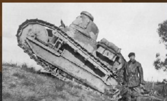
Czołg francuskiej produkcji Renault FT-17 z 1 Pułku Czołgów pod Dyneburgiem, 1919 r. (CAW WBH)

Wiosną i latem 1919 r. gen. Stanisław Szeptycki, dowódca Frontu Litewsko-Białoruskiego, dowodził walką z bolszewikami na wschodzie. 9 sierpnia zajął Mińsk, 29 sierpnia Bobrujsk, 11 września Borysów, 22 września Połock. W październiku i listopadzie 1919 r. trwały negocjacje pokojowe, które przerwano w grudniu 1919 r. wskutek sukcesów armii bolszewickiej w walce z białą armią gen. Antona Denikina. 30 grudnia 1919 r. zawarto sojusz wojskowy między Polską a Republiką Łotewską. Wojsko polskie wsparło Łotyszów w walce z bolszewikami w czasie tzw. operacji Zima. 3 stycznia 1920 r. armia polska gen. Rydza-Śmigłego przy wsparciu sił łotewskich oswobodziła Dyneburg, a następnie usunęła siły bolszewickie z Łatgalii.