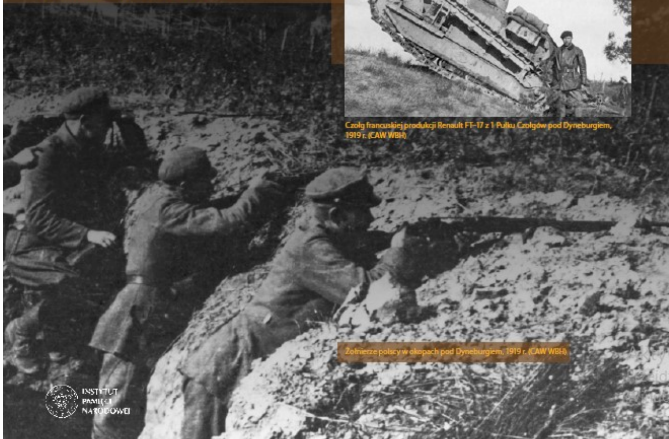
Żołnierze polscy w okopach pod Dyneburgiem, 1919 r.