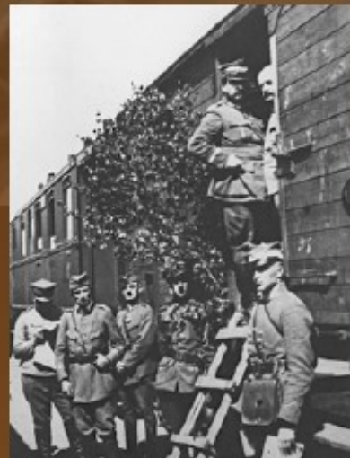
General Józef Haller, Generalny Inspektor Armii Ochotniczej w 1920 r., dowódca Frontu Północnego, przewodniczący Obywatelskiego Komitetu Wykonawczego Obrony Państwa (w pociągu z lewej strony) w otoczeniu sztabu