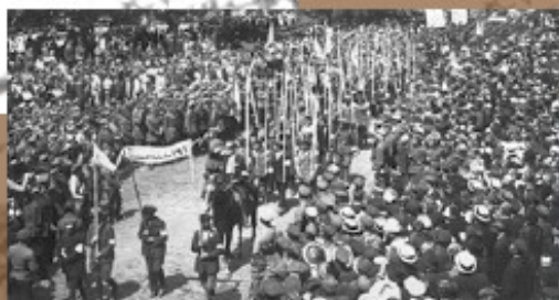
Oddział kosynierów Stowarzyszenia Robotników Niezależnych defiluje przed gen. Józefem Hallerem w dniu święta Armii Ochotniczej. Warszawa, 18 lipca 1920 r.

3 lipca 1920 r. Rada Obrony Państwa podjęła decyzję o utworzeniu Armii Ochotniczej dowodzonej przez gen. Józefa Hallera i wezwała polskich obywateli, aby do niej wstępowali. W Bitwie Warszawskiej i konrofensywie znad Wisty, Wkry i Wieprza wzięli udział m.in. uczniowie, studenci, korporanci, Ochotnicza Legia Kobiet, robotnicy, ochotnicze formacje policji państwowej, Straż Obywatelska. W sumie ponad 100 tys. żołnierzy.