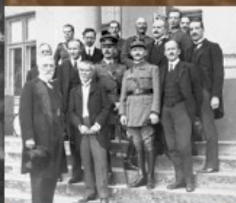
Członkowie Misji Międzysojusznicznej do Polski, sierpień 1920. W pierwszym rzędzie od lewej: lord Edgar Vincent D'Abemon, Jean Jules Jusserand, gen. Maxime Weygand, Maurice Hankey

kpt. Merian Caldwell Cooper jeden z dowódców 7 Eskadry Myśliwskiej im. Tadeusza Kościuszki, składającej się m.in. z amerykańskich pilotów ochotników.