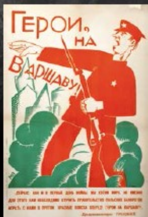
Bohaterowie, na Warszawę – plakat bolszewicki, 1920 r.

Tymczasowy Komitet Rewolucyjny Polski – „Polrewkom”, początek sierpnia 1920. W środkowym rzędzie od lewej: Iwan Skworcow-Stiepanow, Feliks Dzierżyński, Julian Marchlewski, Feliks Kon.