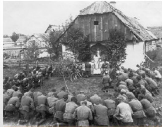
Msza polowa odprawiana przez kapelana 5 Pułku Piechoty Legionów ks. Ziolkowskiego w czasie odwrotu spod Kijowa, lipiec 1920 r.

27 maja 1920 r. skoncentrowane pod Humanem oddziały 1 Armii Konnej dowodzone przez Siergieja Budionnego rozpoczęły atak na polskie oddziały. 5 czerwca 1920 r. „Konarmia” przełamała front pod Samhorodkiem i rozpoczęła energiczny marsz na tyły polskich jednostek. 4 lipca 1920 r. na Białorusi ruszyło główne uderzenie wojsk sowieckich Frontu Zachodniego, dowodzonego przez Michaiła Tuchaczewskiego, na polskie armie Frontu Północno-Wschodniego. Systematyczne oskrzydlające uderzenia wojsk sowieckich na polskie pozycje spowodowały konieczność nieustannego wycofywania się polskich oddziałów z linii frontu. Armia Czerwona odrzuciła wojsko polskie na linię Bugu i Narwi, pokonując w miesiąc dystans ponad 400 km. 10 sierpnia 1920 r. linia frontu niebezpiecznie zbliżyła się do stolicy Rzeczypospolitej – osłabnęła linię Mławy, Przasnysza, Wyszkowa i Siedlec.