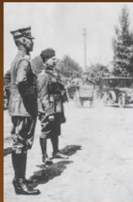
General Władysław Sikorski, dowódca 5 Armii oraz literat Juliusz Kaden-Bandrowski obserwują przemarsz dywizji ochotniczej w Nasielsku, 19 sierpnia 1920 r.