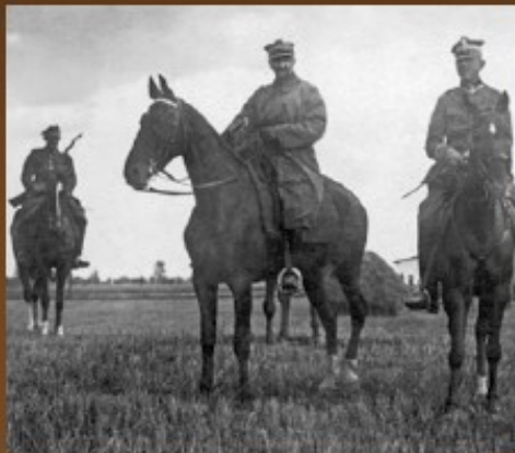
General Tadeusz Rozwadowski (szef Sztabu Generalnego Wojska Polskiego podczas Bitwy Warszawskiej w 1920 r.) w trakcie objazdu frontu pod Warszawą, sierpień 1920 r.