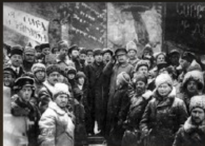
Przywódcy sowieccy (pośrodku Włodzimierz Lenin i Lew Trocki) świętują drugą rocznicę rewolucji październikowej. Moskwa, plac Czerwony, 7 listopada 1919 r.