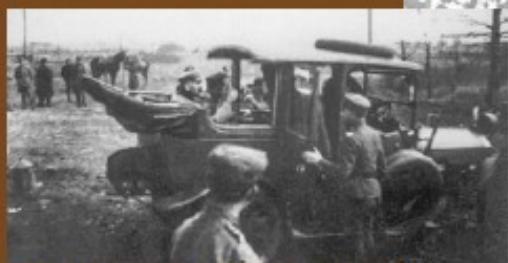
Józef Piłsudski w samochodzie, z którego dowodził kontrofensywą znad Wieprza, 16–26 sierpnia 1920 r.

14 sierpnia 1920 r. 5 Armia gen. Władysława Sikorskiego rozpoczęła kontrofensywę znad Wisły i Wkry w kierunku Zegrza i Nasielska, a następnie w kierunku Ciechanowa. 15 sierpnia 203 Ochotniczy Pułk Ułanów w trakcie zagonu na Ciechanów rozpedził sztab bolszewickiej 4 Armii i zniszczył jego radiostację, przerywając łączność między 4 Armią a dowództwem Frontu Zachodniego. Pomogło to armii gen. Sikorskiego, wspartej czołgami oraz samochodami pancernymi, rozbić prawe skrzydło Frontu Zachodniego (odbiło Ciechanów i Mławę). 16 sierpnia 1920 r. znad Wieprza w kierunku północnym, ruszyła kontrofensywa grupy manewrowej marsz. Józefa Piłsudskiego i gen. Edwarda Rydza-Śmigłego, która weszła w lukę w sowieckim ugrupowaniu dozorowaną przez tzw. Grupę Mozyrską. 17 sierpnia 1920 r. ruszyło natarcie II Grupy Uderzeniowej z Wesołej pod Warszawą na Mińsk Mazowiecki. Kontrofensywa zaskoczyła dowództwo sowieckie, a podległe mu formacje w popłochu wycofywały się na wschód i północ.