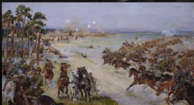
Obraz Bitwa pod Komarowem Jerzego Kossaka. W bitwie stoczonej 31 sierpnia 1920 r. polska kawaleria pokonała I Armię Konną Siemiona Budionnego

Podpisywanie traktatu preliminarnego między Polską, Rosją Sowiecką i Ukrainą SRR w pałacu Czarnogłowców w Rydze, 12 października 1920 r. (CAW WBH)