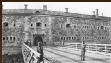
Polska załoga twierdzy Dyneburg, 1920 r.

Wiosną i latem 1919 r. gen. Stanisław Szeptycki, dowódca Frontu Litewsko-Białoruskiego, dowodził walką z bolszewikami na wschodzie. 9 sierpnia zajął Mińsk, 29 sierpnia Bobrujsk, 11 września Borysów, 22 września Połock. W październiku i listopadzie 1919 r. trwały negocjacje pokojowe, które przerwano w grudniu 1919 r. wskutek sukcesów armii bolszewickiej w walce z białą armią gen. Antona Denikina. 30 grudnia 1919 r. zawarto sojusz wojskowy między Polską a Republiką Łotewską. Wojsko polskie wsparło Łotyszów w walce z bolszewikami w czasie tzw. operacji Zima. 3 stycznia 1920 r. armia polska gen. Rydza-Śmigłego przy wsparciu sił łotewskich oswobodziła Dyneburg, a następnie usunęła siły bolszewickie z Łatgalii.