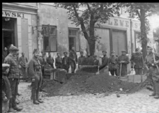
Przekopy uliczne i nasypy wzniesione przez obrońców Płocka, 18 sierpnia 1920 r.

Zadaniem najbardziej wysuniętych na zachód formacji bolszewickich w połowie sierpnia 1920 r. było obejście Warszawy od Północy, przekroczenie linii Wisły i wyjście bezpośrednie na tyły polskich wojsk. W dniach 15–18 sierpnia 1920 r. obrońcy Włocławka skutecznie powstrzymali przeprawę bolszewickich oddziałów przez Wisłę. 18–19 sierpnia 1920 r. III Korpus kawalerii Gaj Chana podjął próbę przekroczenia Wisły w Płocku. Ten atak, po heroicznej obronie, również został odparty przez mieszkańców miasta i oddziały wojska polskiego.