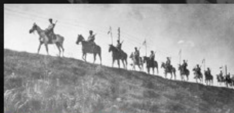
Kawaleria polska w marszu na Lidę, wrzesień 1920 r.