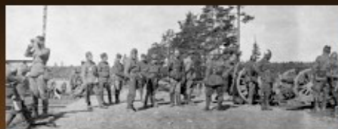
Major Wincenty Kowalski (drugi z lewej), dowódca II batalionu 5 Pułku Piechoty Legionów, obserwuje przebieg bitwy pod Lidą. Widoczni również żołnierze 1 pułku artylerii polowej oraz 5 Pułku Piechoty Legionów, 28 września 1920 r.