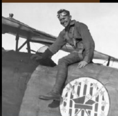
Kapitan Merian Caldwell Cooper, jeden z dowódców 7 Eskadry Myśliwskiej im. Tadeusza Kościuszki, kawaler orderu Virtuti Militari